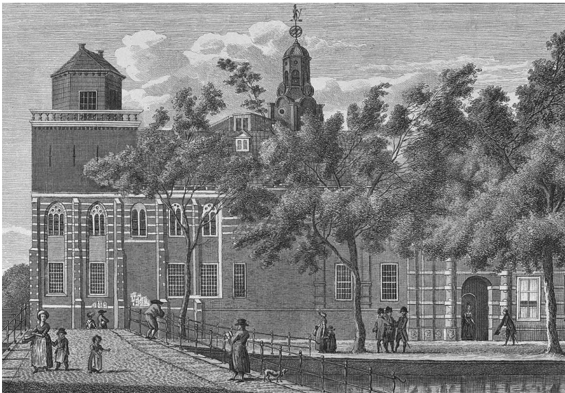
De Academie te Leiden, omstreeks 1790.