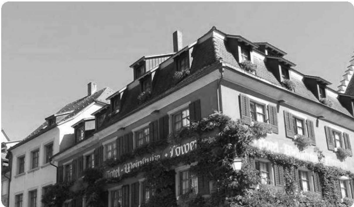
Het vroegere Zum Goldenen Löwe in Meersburg.