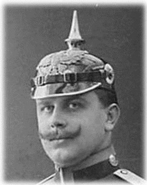
Freiherr Von Richthofen

Eén van de grootste schoften onder het leidinggevend kader was de commandant van het derde opleidingspeloton waar ik tot mijn spijt ook deel van uitmaakte. Gewoon niets anders dan een schobbejak!