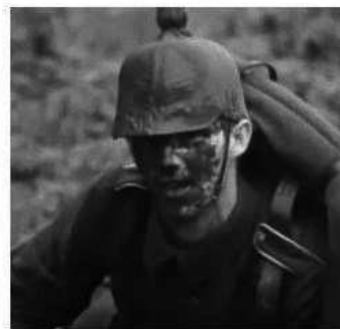
Bij elke stormbaan moet ik het traject minstens twee keer overdoen