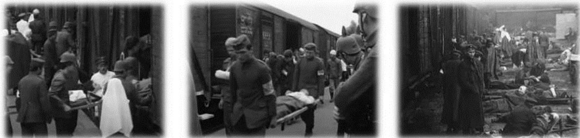
Op het perron wordt door een team van duidelijk overwerkt medisch personeel, ter plekke een korte triage gepleegd. 16

De naakte werkelijkheid kwam voor vrijwel allen als een ontvullende schok!