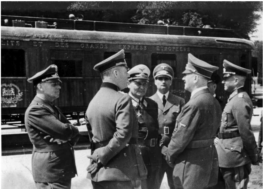
Duitse onderhandelaars, Compiègne, 1940

vertrokken terwijl de aanwezige muziekband het Duitse volkslied en het Horst Wessel lied spelen. Het enige land van militaire betekenis in Europa, Groot-Brittannië, is de laatste hoop. Op de dag van de Duitse inval in Nederland, 10 mei, wordt er een nieuwe leider geïnstalleerd; Winston Churchill. Groot-Brittannië ligt inmiddels ook onder vuur en wordt dagelijks gebombardeerd door de Duitse Luftwaffe. De Amerikaanse ambassadeur in Londen, schrijft aan zijn regering: "Ik kan niet vaak genoeg mijn gebrek aan vertrouwen in de Britten onderstrepen als het om het voeren van deze oorlog gaat. Ik was verrukt om te horen dat de president [Roosevelt] heeft gezegd dat hij niet deel wil nemen aan deze oorlog. Het meedoen aan deze oorlog, ook al stel je je even voor, dat de Engelsen ook maar iets te bieden hebben op het gebied van leiderschap of productiecapaciteit van hun industrie wat enigszins voor ons van betekenis is, zou een complete misvatting zijn." (31) Niets lijkt de opmars van nazi-Duitsland nog te kunnen stoppen.