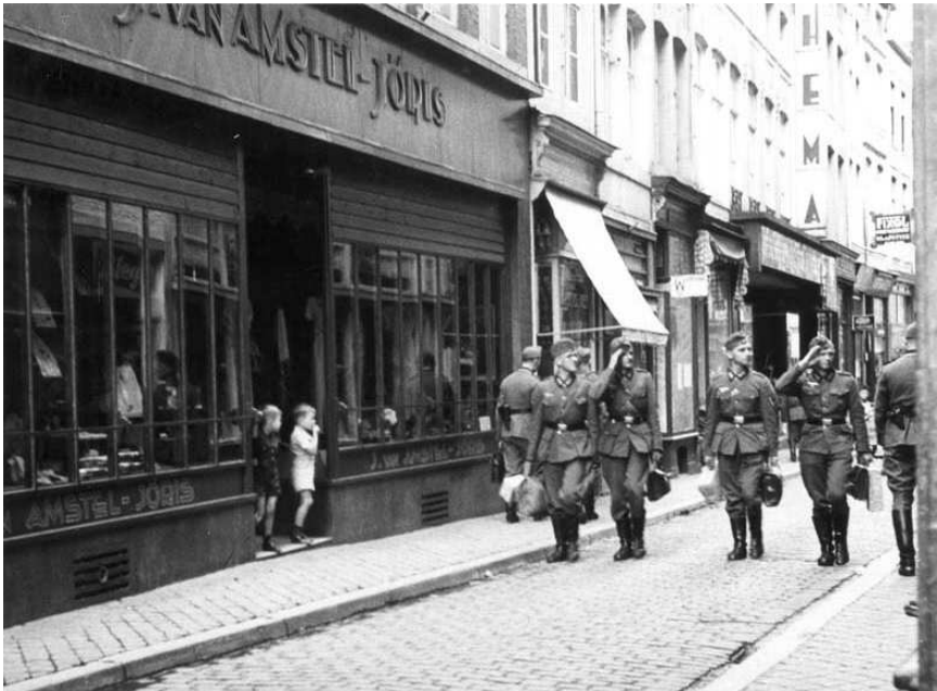
Duitse militairen in Maastricht

Een andere belangrijke maatregel die genomen wordt, opent later de deuren tot de makkelijke vervolging van Joden en andere ongewenste mensen in Nederland zoals verzetslieden. Tot hun verbazing komen de Duitsers erachter, dat in Nederland nog geen goed persoonsbewijs bestaat. Het Nederlands ambtenarenapparaat heeft wel goed gewerkt om de bevolking in kaart te brengen en is in het bezit van nauwkeurige bevolkingsregisters. De Duitsers voeren een legitimatieplicht in en met behulp van de registers zijn zij uitermate goed op de hoogte van de Nederlandse bevolking.