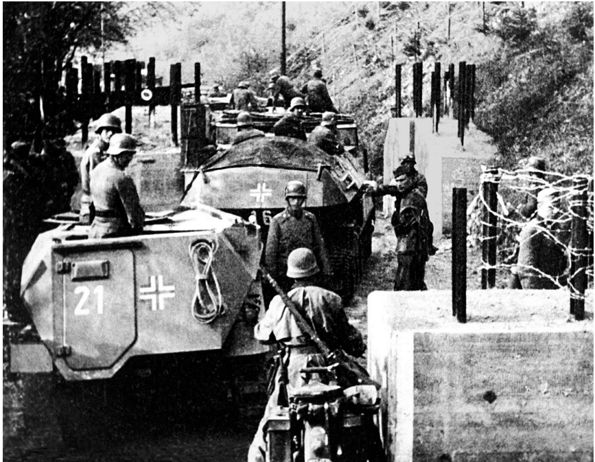
Duitse troepen passeren een Limburgse grensovergang, mei 1940

toch Nederland zijn binnengevallen? En ja hoor. Niet lang daarna wisten we het. Het was dus waar. Overal hoorden wij afweergeschut en andere vuurwapens. Tien minuten later bereikte ons het wrede bericht dat de Duitsers de Nederlandse grens overschreden hadden.” (9)