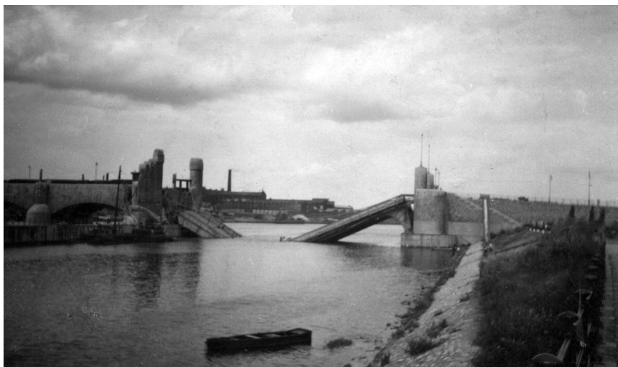
Vernielde brug over de Maas in Maastricht, mei 1940