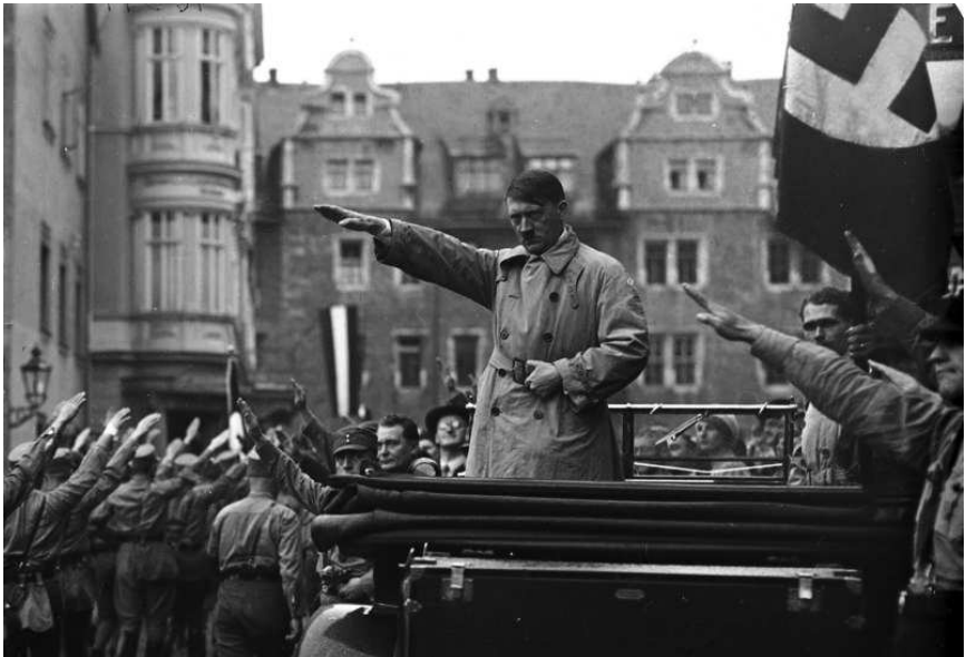
Adolf Hitler in 1930

De Oostenrijker Adolf Hitler is met steun van een bevolking die gebukt gaat onder de represaillemaatregelen als gevolg van de Eerste Wereldoorlog, vanaf 1933 aan de macht in Duitsland. Hitler bouwt Duitsland economisch weer op en geeft de bevolking zelfvertrouwen. De leider van de nazipartij droomt groot en met veel bluf weet hij zijn eerste stappen te zetten naar zijn utopie, 'het Derde Rijk'. Met het geweldloos inlijven van Oostenrijk bereikt Hitler zijn eerste doel. Daarna bezet hij het Sudetenland, aan de oostkant van Duitsland. Het pokerspel lijkt te werken, want de regerende Europese grootmachten, Groot-Brittannië en Frankrijk, grijpen niet in.