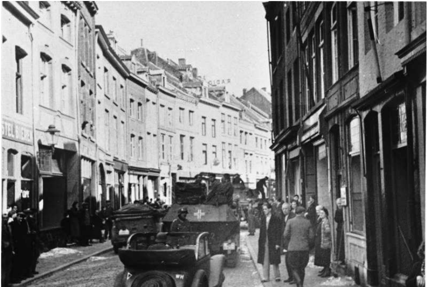
Duitse troepen in Maastricht 10 mei 1940

Nederland krijgt een burgerbestuur onder leiding van de Oostenrijkse nazi Arthur Seyss-Inquart. Het doel is de nazificering van Nederland, zodat het land kan worden ingelijfd in het Groot Duitse rijk. Nederlandse bestuursleden worden aan de kant geschoven en belangrijke posten komen in handen van NSB'ers en Duitsers. Daarmee worden de regels steeds strakker aangehaald en gelijkgetrokken met nazi-Duitsland. Een eerste logische stap is het gelijkstellen van de tijden van de ingenomen landen. De tijdzones in Europa verschillen sterk tijdens de meidagen van 1940. In Nederland verschilt de tijdzone in de eerste jaren van de 20ste eeuw zelfs, met seconden tussen diverse plaatsen. Daarna wordt tot 1937 de Amsterdamse tijd nationaal ingevoerd; twintig minuten en 32 seconden later dan de Britse standaard GMT. Dit verschil wordt genormaliseerd tot 20 minuten. Hierdoor heeft Nederland een andere tijdszone dan buurlanden België en Duitsland. Om de uren van licht te maximaliseren wordt er tijdens de Eerste Wereldoorlog door de strijdende partijen al geëxperimenteerd met zomertijd. In de eerste dagen van de Tweede Wereldoorlog voeren Duitsland en Groot-Brittannië de zomertijd in, Nederland gaat dat pas op 16 mei