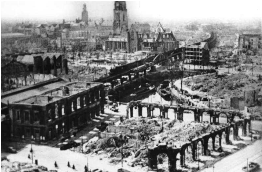
Rotterdam na het bombardement in mei 1940

de kelder gebracht, ze zijn volkomen de kluts kwijt. Allerlei andere mensen komen schuilen. Op een gegeven moment zitten we met 27 mensen in de kelder. 's Avonds brandt de gehele stad, een beroerd gezicht.” (25) Het bombardement kost aan 800 inwoners het leven, de stad die in 1940 zijn 600-jarig bestaan viert ligt in puin. Een van de inwoners waagt zich na het bombardement op straat, terwijl de stad nog brandt. “Er zijn zeer veel doden in de stad. We hebben geholpen waar we konden. (...) De lijken worden gewoon in stapels op vrachtwagens geladen (...) Onder het puin liggen er nog zeer veel. Het is warm weer, de stad is zeer warm door de brand. De lijkenlucht in de stad wordt al gauw verschrikkelijk. Het stinkt als de pest.” (26)