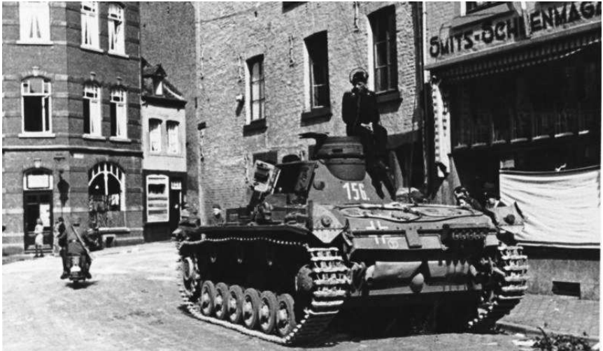
Een Duitse Panzer in de straten van Maastricht, 10 mei 1940