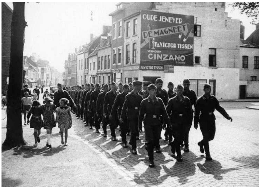
Duitse kolonne marcheert door de straten van Maastricht, mei 1940