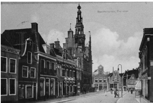
Stadhuis en Raadhuisplein Franeker.