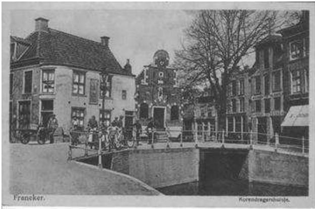
Het vermeende geboortehuis van Trijntje links naast het Korendragershuisje (ingrijpend gewijzigd in de 50-er jaren van de 20 e eeuw).