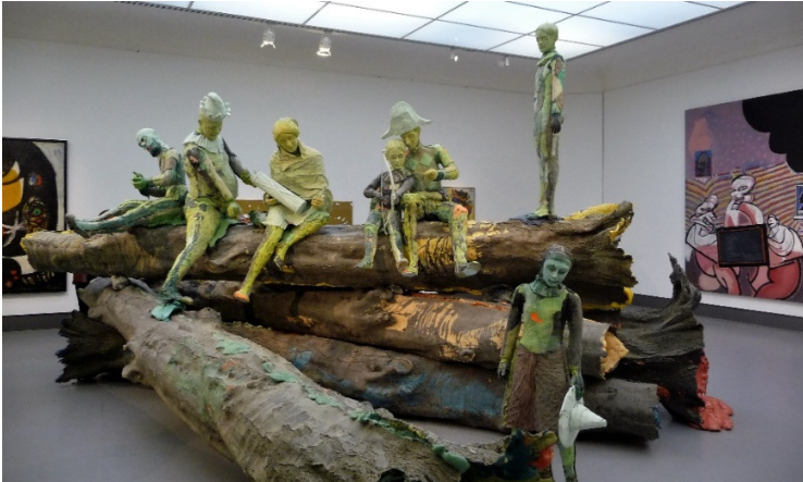
(styrofoam en gekleurd polyurethaan foam)