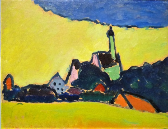
Alexej von Jawlensky, Landschap – Murnau , 1909, olieverf op dubbelzijdig gecacheerd karton

Murnau, een Duits dorp aan het begin van de twintigste eeuw; het is eigenlijk niets. Een paar huizen en een kerk, zo te zien. Verder wat groen dat het dorp in groeit, een blauwe lucht en heel veel geel. Dat is het wel. En als je nu kon zeggen dat het met zorg op het karton is gezet, nee. Een paar lijnen, dikke zwarte en blauwe lijnen, uit de losse pols erop gemikt en daarna met verf ingevuld. Als je goed kijkt ziet het er zelfs slordig uit: een schilderij van een kwartier, zou je zeggen, hooguit.