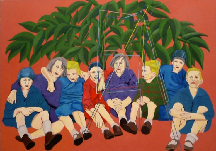
Onder de chocoladeboom