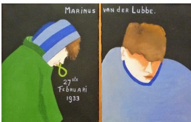
Marinus van der Lubbe 1971, olieverf op doek, twee delen