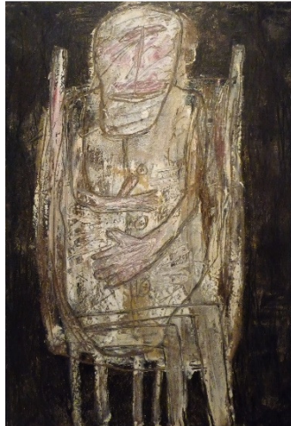
Oude geslepen babbelaar , 1957, olieverf

In het Stedelijk Museum Amsterdam trof ik vandaag de beide hier bovenstaande schilderijen. Steeds weer bijzonder.