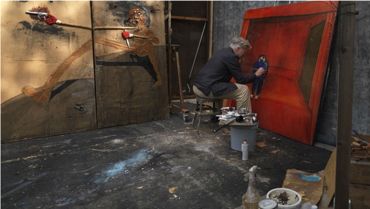
Lynch aan het werk in zijn studio

Het Bonnefantenmuseum in Maastricht pakt groot uit met een tentoonstelling over de veelzijdige, Amerikaanse kunstenaar-cineast David Lynch, getiteld Someone Is In My House . In maar liefst vijftien zalen en zaaltjes zijn werken op papier te zien, installatie-achtige schilderijen, foto's, film-stills, video en alles wat een kunstenaar maar kan bedenken. Het is overdonderend, temeer daar van zijn meeste werk een stille dreiging uitgaat. Colour is me too real blijkt uit alles, een uitgangspunt dat met name, maar niet alleen, in zijn fotografie tot uitdrukking komt.