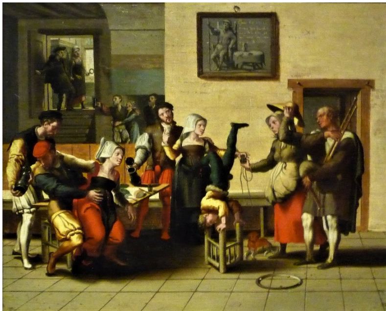
Monogrammist van Brunswijk (navolger), werkzaam te Antwerpen, ca. 1530-1550: Herbergscène

Tot voor kort had ik niet van haar gehoord, maar sinds haar tentoonstelling Oh God , vorig jaar in het Bonnefantenmuseum in Maastricht, kom ik haar vaker tegen. Deze week overigens in hetzelfde museum met een installatie, een kerkje ( Church I ) en een enorm schilderij van zo'n vier bij drie-en-een-halve meter. Opnieuw nam ze de taak op zich een eigen interpretatie te scheppen van een tot de voorraad van het museum behorend schilderij, een herbergscène dit keer, geschilderd ergens tussen 1535 en 1540. Het is duidelijk dat haar weergave in een meer eigentijds gebeuren is veranderd, al zou je daarover