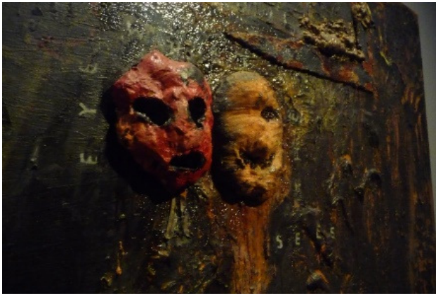
Dr. Howl's Philosophy