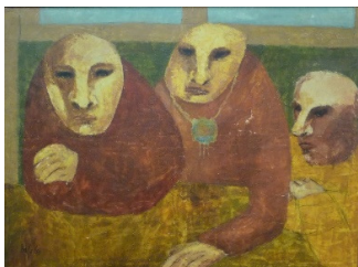
Verdienste III, 1964, olieverf op doek

in zijn achterhoofd hebben gehad. Mensen die vreemd zijn, in allerlei opzichten afwijken, maar toch heel herkenbaar zijn.