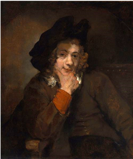
Titus , ca. 1660

Dit jaar viert cultureel Nederland het feit dat zijn grootste kunstschilder 350 jaar geleden overleed. Er zijn tentoonstellingen en kunstzinnige herdenkingen op tv en natuurlijk pakt ook het Rembrandthuis in Amsterdam groots uit. Hoogtepunt is ongetwijfeld het van het Baltimore Museum of Art voor deze gelegenheid in bruikleen gekregen schilderij van Titus, zoon van Rembrandt. Dat wilden we zien, want nooit eerder werd het doek in Europa tentoongesteld.