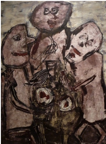
Geroosterd rundvlees , 1957, olieverf

Het is een zwakte, ik weet het, maar als ik ergens een schilderij tref van Jean Dubuffet (1901-1985), moet ik er een foto van nemen. Om er later nog eens rustig naar te kunnen kijken. Zelf noemde hij zijn kunst Art Brut , waarmee hij aangaf sterk te zijn aangetrokken tot het onge Kunststelde in de kunst, het spontane, werk van niet als zodanig opgeleide mensen. Het begon bij hem met een grote aandacht voor tekeningen en schilderijtjes van kinderen, gevangenen, geestelijk gehandicapten. Eerst vanaf 1942 stortte hij zich ook zelf op het kunstenaarschap. Door zijn manier van werken werd hij een belangrijke inspiratiebron voor de CoBrA-beweging.