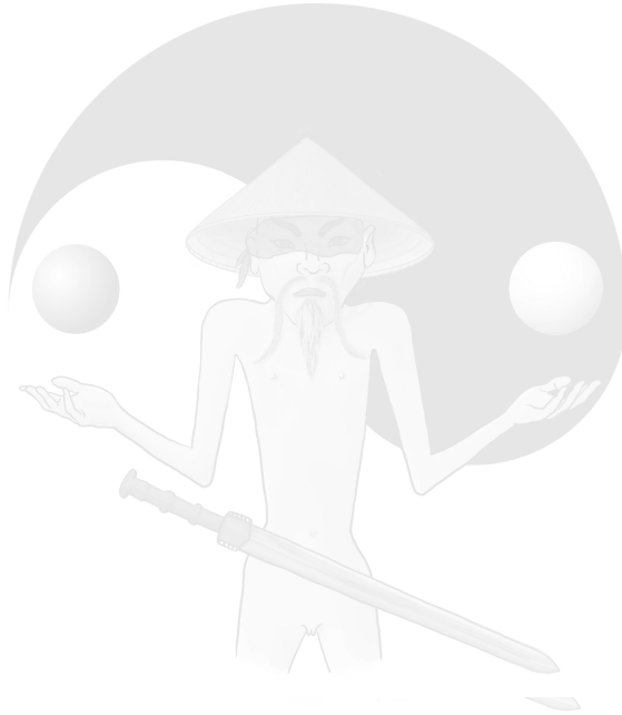
De niet-vorm van de niet-meester.

Je begrijpt, het is niet mijn bedoeling Meester Tja definitief vorm te geven – juist niet.