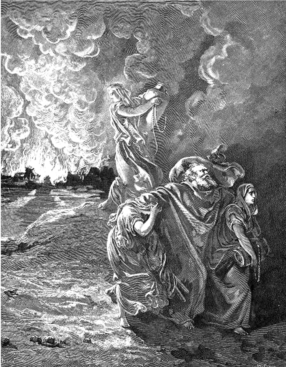
Lot verlaat Sodom

9 Toen zeiden zij: Kom verder aan! Voorts zeiden zij: Deze ene is gekomen, om als vreemdeling hier te wonen, en zoude hij alleszins rechter zijn? Nu zullen wij u meer kwaads doen, dan hun. En zij drongen zeer op den man, op Lot, en zij traden toe om de deur open te breken.