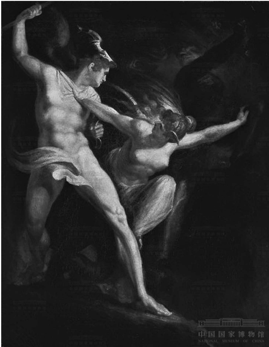
Een voorstelling van satan...