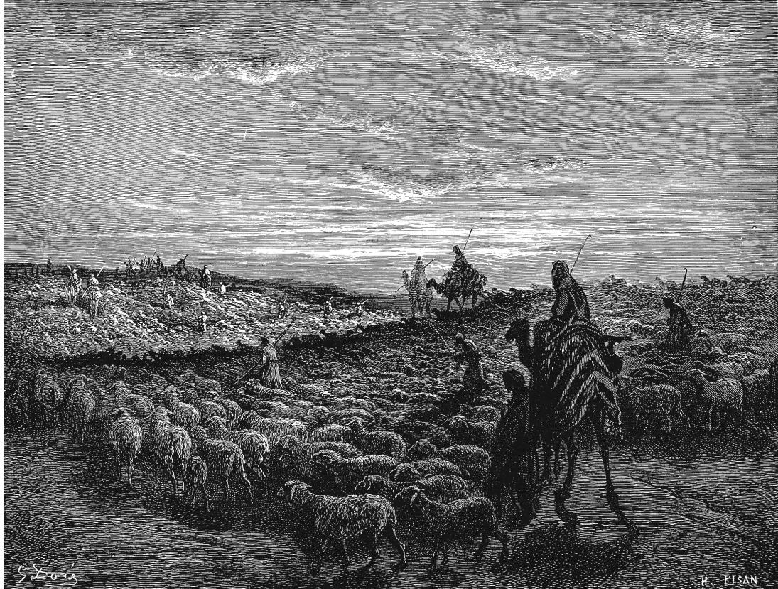
Abraham op weg naar het beloofde land. (afbeelding is ongetwijfeld goed bedoeld maar kamelen waren toen nog niet beschikbaar...)

© William Geller Zie ook: http://www.AAABoeken.nl ISBN-nummer 9789464059960