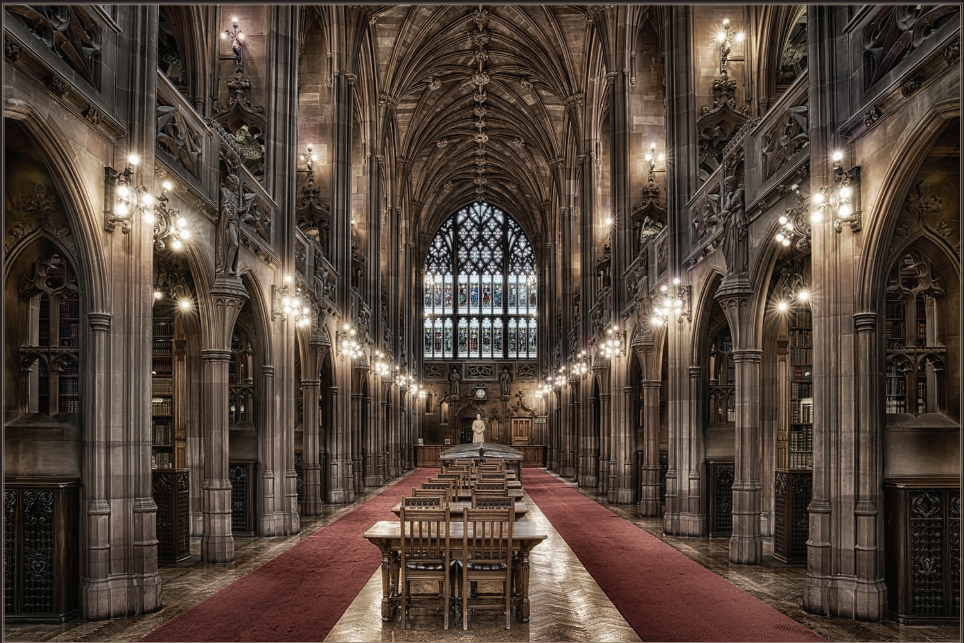
John Rylands library Manchester