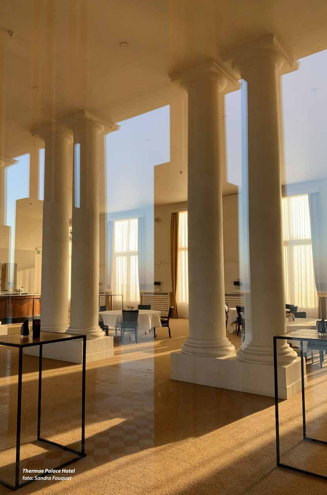
Thermae Palace Hotel