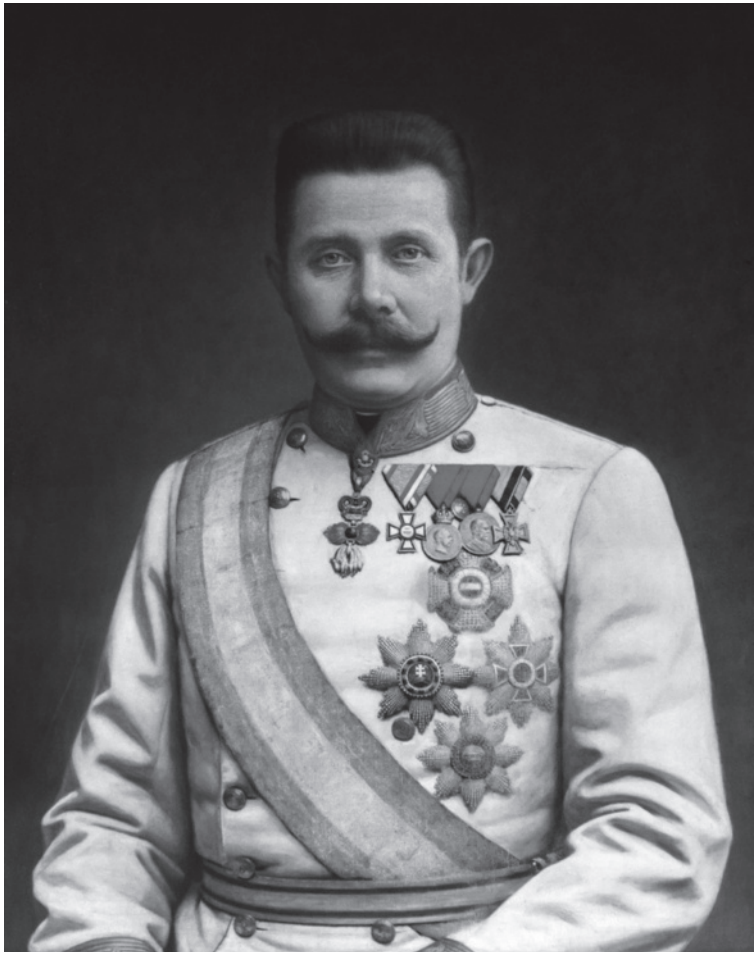
Aartshertog Franz Ferdinand van Oostenrijk-Este (1863-1914)