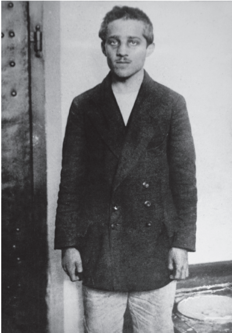
Gavrilo Princip (1894-1918)