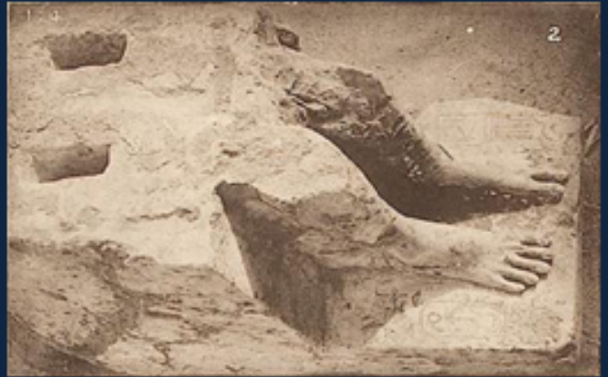
Deurpost met de Cartouche Deel van een beeld van Djedkare-Isesi gevonden in Abydos door Petrie 5de dynastie

Pepi stelde een tweede vizier aan, zodat er een vizier in het noorden was en één in het zuiden, ver weg van Memphis in Thebe.