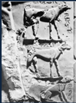
KONING ANTEF II WAHANKH 2118-2069 BC Graf Saff el-Dawaba in Tariff Qurna

De zoon van Mentuhotep I en Nefru I regeerde bijna 50 jaar en bouwde monumenten en tempels voor de goden en richtte zelfs het eerste monument op voor de god Amun in Karnak.