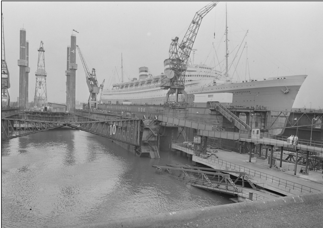
De Nieuw Amsterdam in het dok van Wilton Feyenoord 6

Wanneer ik, aangekomen bij de werf, van mijn fiets stap ben ik werkelijk onthutst over de afmetingen van het schip: 232 meter lang, 26 meter breed en een tonnage van 36.000. Eén van de grootste passagiersschepen van die tijd. 7 En zeker het tot nu toe grootste passagiersschip, ooit in Nederland gebouwd. Met een bemanning van bijna 500 mannen en vrouwen kan het ongeveer 750 passagiers vervoeren. Ik weet dat de Nieuw Amsterdam al bijna dertig jaar oud is, in 1937 voor het eerst te water is gelaten en in 1938 als “Vredesschip” haar eerste tocht maakte. Voorts dat het schip al twee jaar later door de Britse regering werd geconfisqueerd als troepentransportschip en rond de 350.000 manschappen van de Verenigde Staten naar Europa en omgekeerd tienduizenden gewonden van de westelijke fronten naar Amerika heeft vervoerd. Met ongeveer 4.000 militaire passagiers waren dit bijna 90 tochten heen en terug van telkens ca. 24 dagen, naast andere bestemmingen.