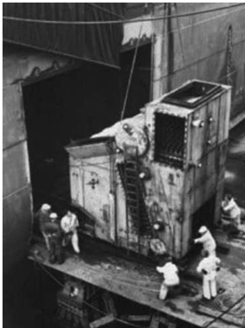
De nieuwe ketels worden geplaatst

'Met respect meneer, het lijkt alsof u persoonlijk bij die verbouwing betrokken bent' De man lacht. 'Nee hoor, ik heb als werktuigkundige alleen zuiver belangstelling voor de oplossing die de mannen van de werf hebben bedacht. Mijn naam is Verkerk, ik ben werktuigkundige en specialist op het gebied van stoomketels.' Ik neem aan dat jij op het punt staat aan te monsteren? 5 'Jawel meneer, ik heb al aangemonsterd. Ik wil alleen weten wat voort gevaart het komende jaar mijn "thuis" zal worden.'