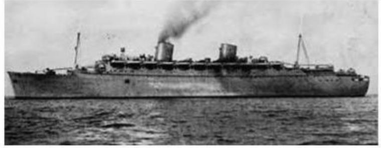
Links: De "Nieuw Amsterdam" op haar eerste vaart in 1938. Rechts: Tijdens de Tweede Wereldoorlog als troepentransportschip

Het is onmogelijk om even aan boord te kijken, want alle drie loopplanken zijn bewaakt en alleen geregistreerde arbeiders krijgen toegang tot het schip. Ik probeer me voorbij de wacht te bluffen, maar word vierkant uitgelachen. Ik blijf zeker een uur op de werf rondhangen om de eerste indrukken van het schip zo goed mogelijk op mij te laten inwerken. De zilvergrijze romp, de witte opbouw en geel met groen geschilderde funnels . 8 Totdat ik door een nijldige veiligheidsbeambte word weggejaagd: "He joh! Ga je moeder peste! Oprotte!" op sappig, maar zéér goed verstaanbaar Rotterdams. Ik neem, gelet op de brede schouders en de lage haarimplant van de bewaker, geen risico's en vind dat ik onder de huidige omstandigheden voor het moment genoeg heb gezien.