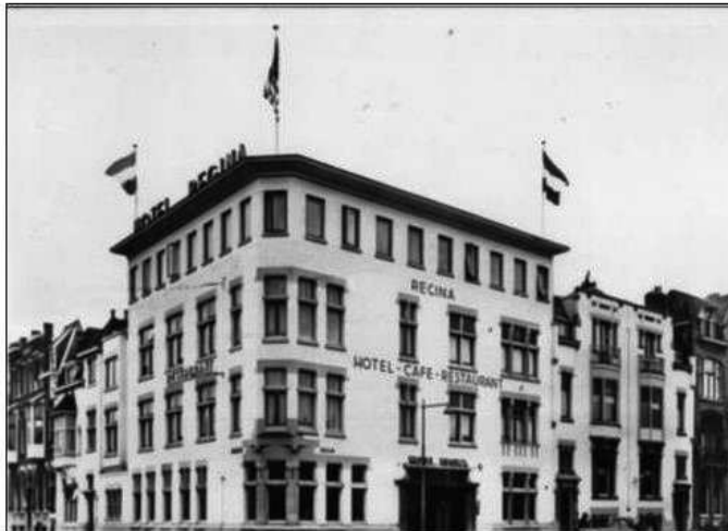
Hotel Regina op de Spoorwijk 75. Eén van mijn hoofdtaken was het hijsen en strijken van de vlaggen

bediende vrijwel elke dag gefeut werd, zoals door mij te laten zoeken naar de "map met zoekgeraakte stukken", "de stukken voor het vijfde kwartaal", een doosje "rasterpuntjes", een "plintenladdertje" of dergelijke ergerlijke onzin. Mijn onderhuidse voornemen was dat ik met mijn leven iets 'anders' zou gaan doen. Waarbij mijn heimelijke wens was om vreemde landen te bezoeken en zo