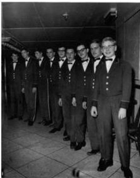
De zéér oncomfortabele groene winteruniformen van de "bell boys"

van onder een kerkklok sprak. Hij had zijn leesbril in een Chinees restaurant op de Beukelsdijk laten liggen, die ik - te voet - ging ophalen en waarvoor hij me beloonde met een fooi van zes gulden! De voornaamste reden waarom ik de man in mijn geheugen heb opgeslagen. Daarnaast een vrijwel permanent zéér dronken, "exotische" Noor van méér dan honderdtwintig kilo, die ik bij gebrek aan een lift, 's avonds vier dagen aangesloten naar de derde verdieping moest