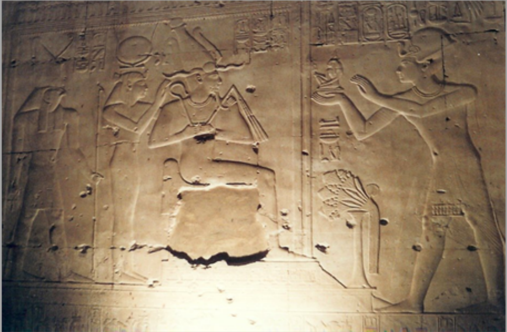
Osiris, Isis en Horus staan voor koning Seti I die hun een beeldje van Maät geeft