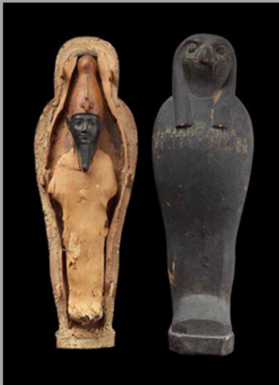
Graan Mummie Een houten kistje in de vorm van een valk die Horus voorsteld. Het kistje bevat een graanmummie van Osiris hij draagt hier de Witte kroon. Nu in het Museum in Boston Amerika Dit waren de magische rituelen waar een mummie lichaam van tarwe , gerst of andere granen in een kistje lag. Met de begrafenis wordt er water overheen gegoten en dan gaan de zaden onkiemen, dit is symbool om een nieuw leven te laten beginnen. nieuwe oogst is ook verbonden met nieuw begin en leven