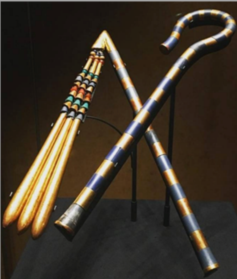
De vlegel en de kromstaf attributen van Osiris deze zijn gevonden in het graf van Toetanchamon

De koningen Seti I en zijn zoon Ramses II bouwde iedere een prachtige tempel ter ere van Osiris.