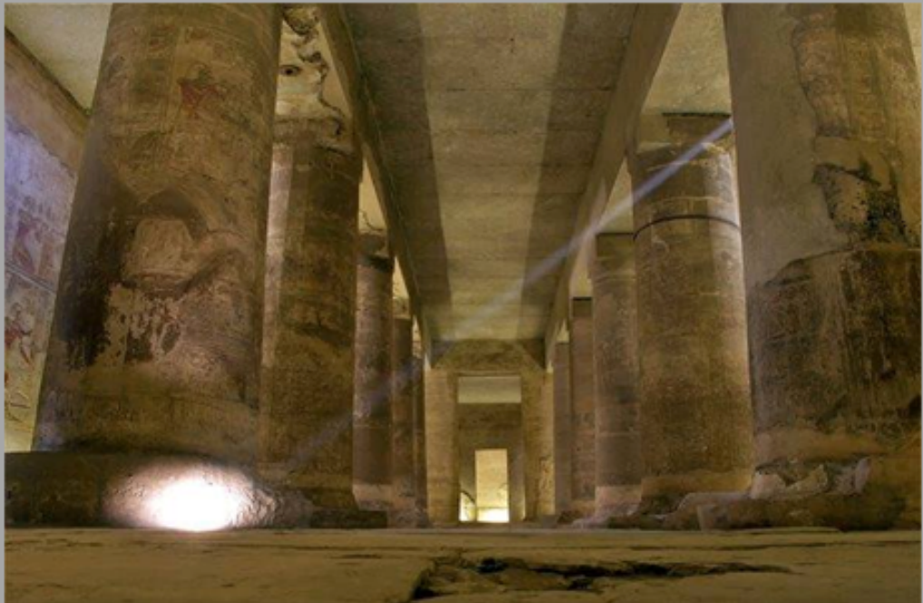
Het geheime heiligdom van Osiris in het binnenste gedeelte van de tempel