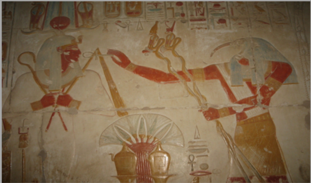
De geheime kapellen van Osiris hij staat hier voor de god Thot van wie hij het eeuwige leven krijgt. En Thot heeft ook nog twee stokken in de hand waar 2 slangen omheen gedraaid zijn en zij dragen de kronen van Opper- en Neder Egypte