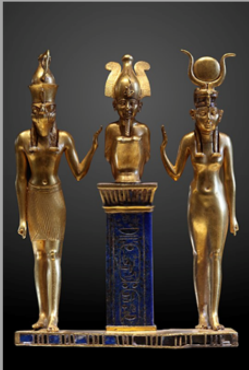
De triade van Osiris en Isis en hun zoon Horus goud en Lapis Lazuli Museum Caïro