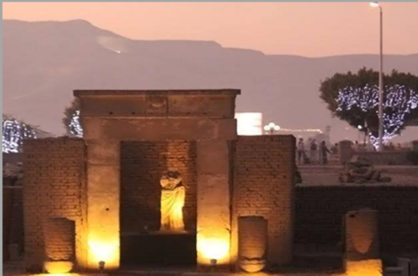
In de tempel van Luxor staat ook een tempel voor Isis en Serapis met op de achtergrond de magische bergen van de Westbank

Ik wil iedereen bedanken voor de bijdrage van de foto's: James Henri Breasted, André de Ruiter en iedereen van wie ik foto's heb gebruikt en niet (meer) weet van wie ze zijn.