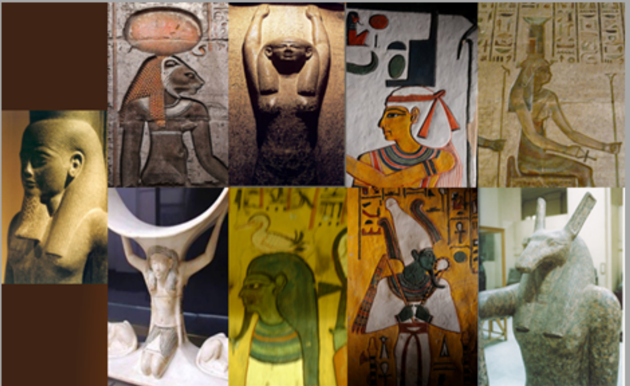
De Enneade van Heliopolis, Atoem, Sjoe, Tefnut, Geb, Nut, Osiris, Isis, Seth en Nephthys

Hij was van gelijke substantie als zijn overgrootvader en daarmee de vleesgeworden Schepper.