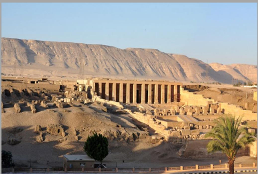
Tempel van koning Seti I in Abydos gewijd aan de god Osiris

Door de hoop op een nieuw leven na de dood begon Osiris in verband te worden gebracht met de natuur en alles wat daarin werd waargenomen, met name de vegetatie en de jaarlijkse overstroming van de Nijl, door zijn banden met de opkomst van Orion en Sirius aan het begin van het nieuwe jaar.