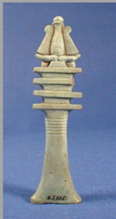
De Djedzuil symbool van Osiris