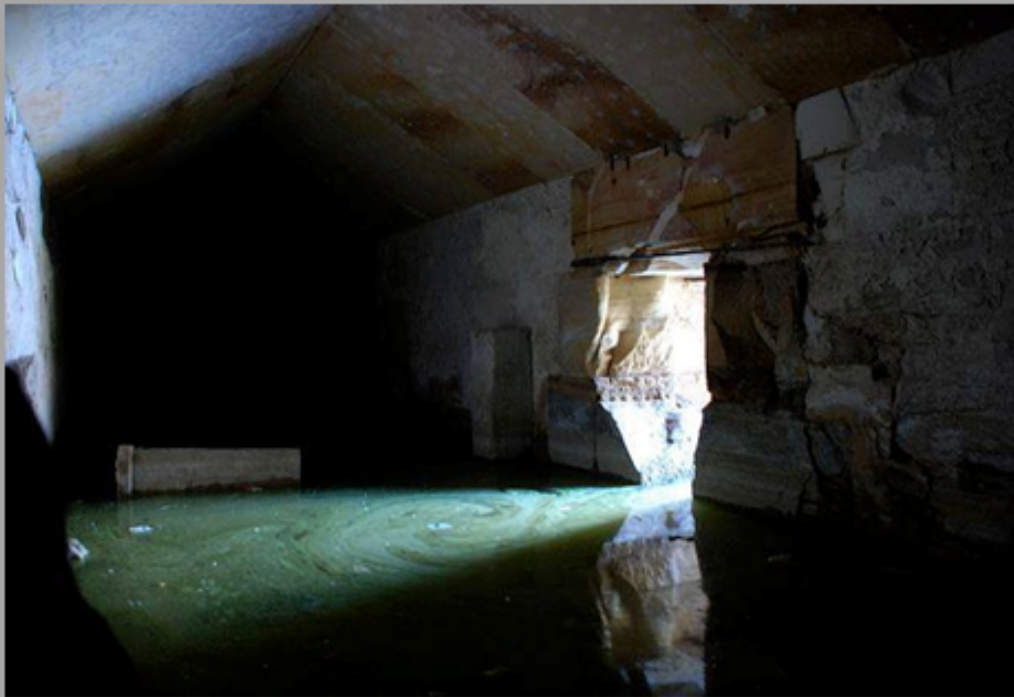
De ruimte van het symbolische graf van Osiris

Als het hart echter zwaarder was dan de veer, door alle zonden, dan werden het hart en de dode door een monster, de Verslinder opgegeten.