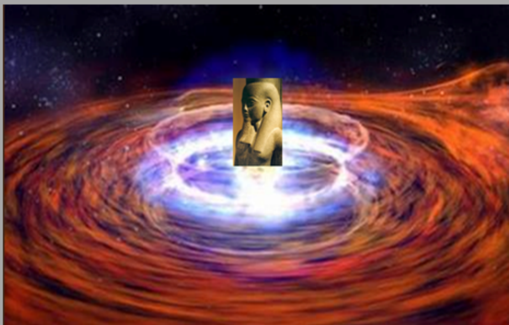
ATOEM BRENGT ZICHZELF VOORT UIT DE NOEN

De wereld werd geschapen uit de oer-oceaan, de Noen waaruit het eerste land als een heuveltje te voorschijn kwam, dit is een beeld dat ingegeven is door de wijze waarop het boerenland van Egypte ieder jaar weer uit de Nijl overstroming opkwam.