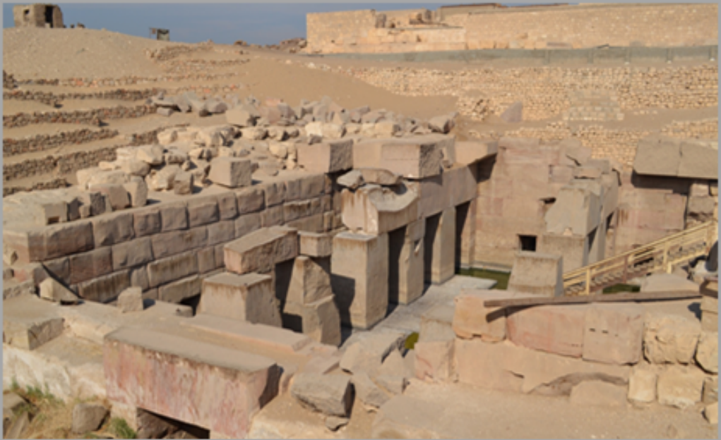
Het Osireion met het symbolische graf van Osiris. Dit ligt achter de tempel van Seti I in Abydos