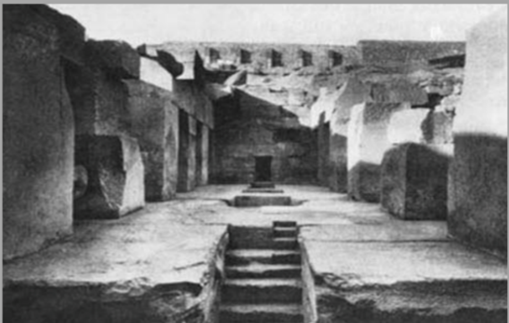
De centrale hal in het osireion met achteraan de ingang van het symbolische graf van Osiris