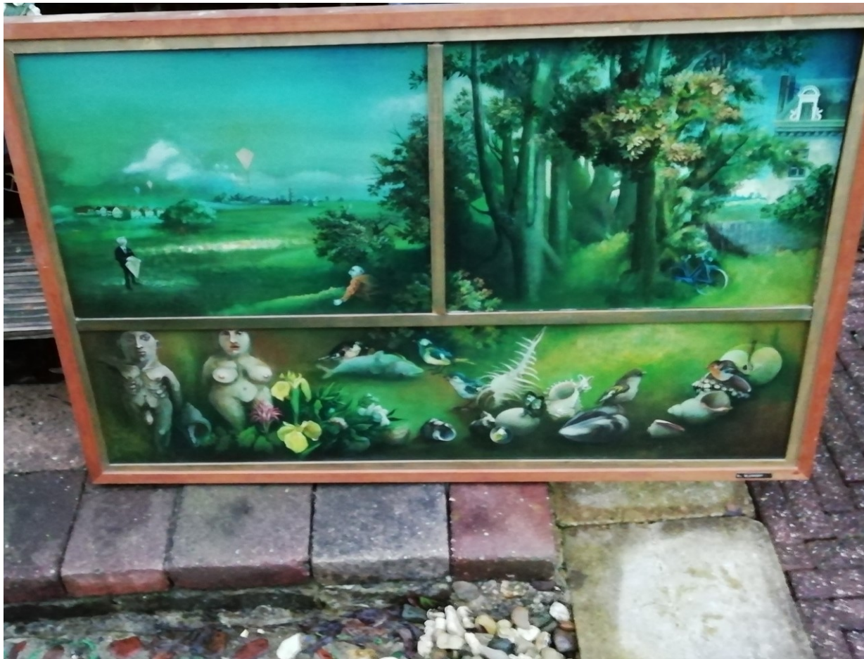
Impressie van 'Landschap met vliegers'. of 'het Echtpaar V' Door de ongelooflijk verfijnde techniek laat dit schilderij zich niet fotograferen. Beroepsfotografen met de duurste camera hebben hun tanden erop stuk op gebeten, hun foto leverde nooit genoeg kwaliteit op voor opname in een catalogus. Door subtiel gebruikte verflagen kunnen forse kleurverschillen optreden In de volksmond staat dit schilderij bekend als 'Meesterwerk'. 1966, 67x105 CJB