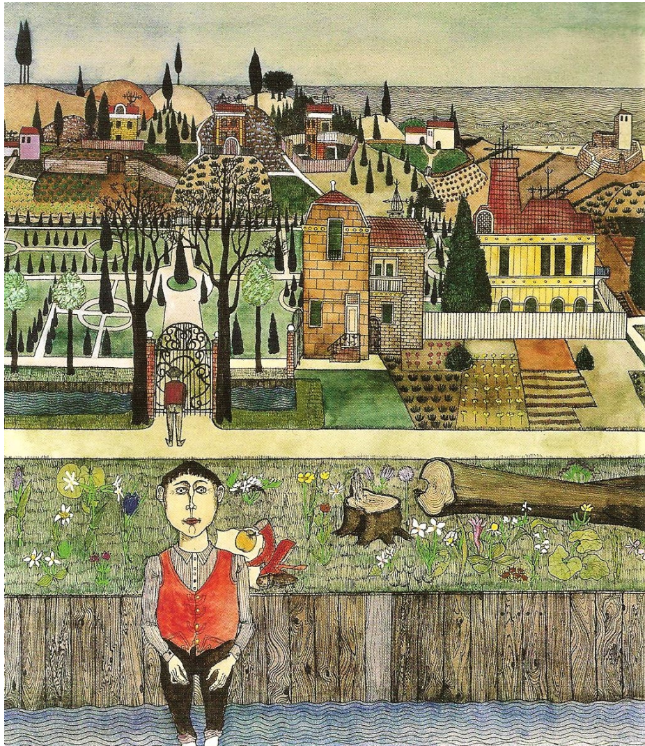
In de beek staan, begin 1963, 56x50, collectie kunstenaar, verder CK