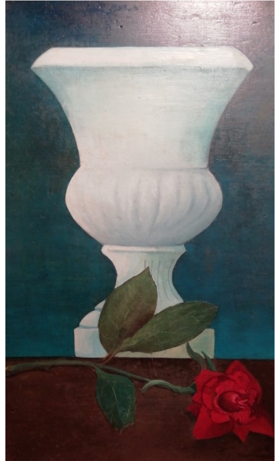
Naakte Man, oktober 1962-april 1963 In 1966 deel drieluik, linker buitenpaneel, PC Ca 90x50cm Boven: Witte vaas met roos, 1963, 31x20 Bruikleen CJB van CK