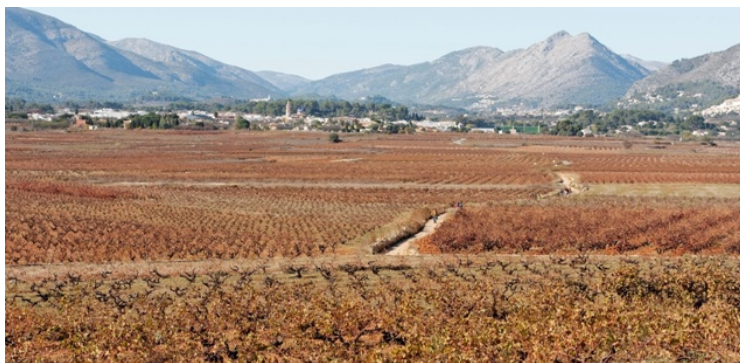
Druivenvelden in de Jalónvallei

De nieuwe residenten blijven niet komen. Het bouwen gaat bergaf. Er kunnen geen bars en restaurants blijven bijkomen. De natuur wordt door de mens gedeeltelijk weer overeind geholpen. Die landbouwvelden vormen nu een uitstekend decor om wandeltochten te organiseren die geen inspanning vereisen en die we in dit boek gaan ontdekken.