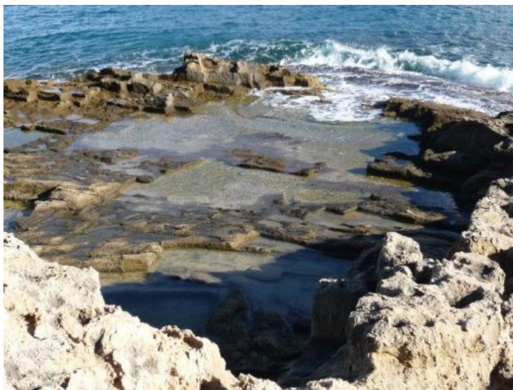
Een groeve van toscasteen

Bijvoorbeeld bij de Muntanyars in Jávea, tussen de haven en de Playa Arenal, in Calp bij de Baños de la Reina of in Moraira bij het kasteel, maar ook nog op vele andere plaatsen. Deze stenen zijn nu, net als oude Arabische dakpannen, veel duurder dan de andere stenen.