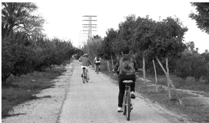
Allemaal gemakkelijke wegen

Soms wordt een landweg geasfalteerd, soms wordt een boom omgehakt, soms wordt er ergens plotseling een huis gebouwd of een weg om één of andere reden afgesloten. Aan de hand van de plattegronden kan men in zo'n geval dan altijd wel een alternatief vinden. De meeste wandelingen duren ook minder dan drie uur, dus voor iedereen haalbaar.