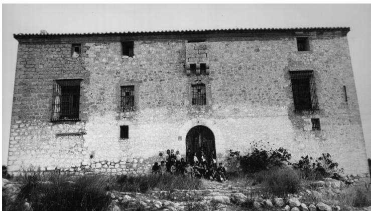
Het Casa Nova (nieuw huis) in Calp, voor de restauratie.

Het materiaal waaruit ze werden opgetrokken veranderde in de loop der tijden, maar de plaats waar ze gebouwd werden was ook van invloed. In de bergstreken gebruikte men hoofdzakelijk de rotsstenen en bouwde men op de wijze van de piedra seca . De portalen en raamkozijnen werden gemaakt door gehakte stenen. In de Middeleeuwen begon men met het gebruiken van een soort mortel, gemaakt uit leem, dat later vervangen werd door een soort mortel, gemaakt met zand en ongebluste kalk. In de streek van de Costa Blanca vervingen deze masías de oude moorse nederzettingen, waarvan men de stenen gebruikte om de hoeve te bouwen. Heel vaak beschikte die masía over een verdedigde gevel, want in die tijd waren de invallen van de piraten langs de kuststreek nog vrij frequent.