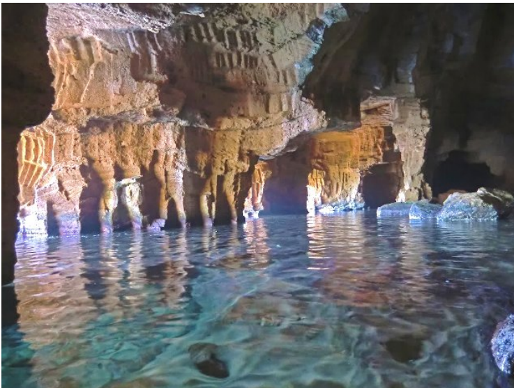
Cova Tallada, nu bedreigd door te veel toerisme

Deze zandsteen was heel populair als bouwsteen en die groeven werden al uitgehakt door de Romeinen en nog tot 1972, toen het verbod werd opgelegd om ze nog verder uit te hakken. Een belangrijke groeve van deze toscasteen was de Cova Tallada (de uitgehakte grot) tussen Jávea en Denia, nu een grote toeristische bezienswaardigheid. Men heeft zelfs de toegang moeten beperken.