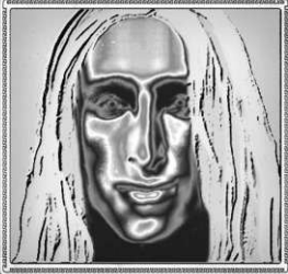
Hugh Sloan Getransformeerd in 485 NC

Hugh Sloan, geboren 28 april 458 NC. Zover bekend de eerste die onsterfelijk werd. Zijn vader is Brynn Sloan, zoon van een Ierse vader en Deense moeder. Zijn moeder is Lucina Olgeson dochter van een Ierse vader en Ierse moeder. Lucina Olgeson vlucht met Hugh naar Denemarken. Daar wordt Hugh opgevoed door een achternicht van zijn vader. Als Hugh achttien is, reist hij terug naar Engeland en vandaaruit door naar Wales. Hij huwt daar een Welse, Aeron Evans. Hugh draagt zonder dat hij het weet de BloedVloek in zich. Hierdoor transformeert hij na een kort ziekbed spontaan naar onsterfelijkheid in het jaar 485 NC.