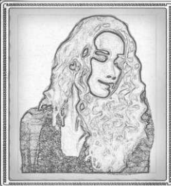
Meara Carpenter - Sloan Getransformeerd in 1450 NC

Owen Sloan, geboren 1 december 1320 in Schotland is de bet-achterkleinzoon van Riley Sloan. Owen draagt vanaf zijn zevende levensjaar de titel graaf. En heeft meerdere kastelen en landerijen in zijn bezit. Hoewel Owen zeer geliefd is bij de dames, blijft hij ongehuwd en kinderloos. Tijdens de Slag bij Crécy op 26 augustus 1346 nabij het plaatsje Crécy in Picardië, waarbij de Franse koning Filips VI werd verslagen door de Engelse koning, Eduard III komt hij oog in oog te staan met zijn betovergrootvader Riley Sloan. Riley slaat Owen bewusteloos en ontvoerd hem terug naar Schotland. Daar in een vergeten kasteel, besmet Riley Owen met de BloedVloek.