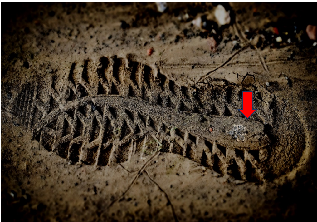
Voetafdruk met het Vaticaan embleem

“Nope Doc... Dat kan al zeker niet want dan zou die verdwaalde wandelaar een bootje moeten hebben om tot hier te raken, maar bekijk de afdruk van de hiel.”, maande de rechercheur zijn vriend aan.