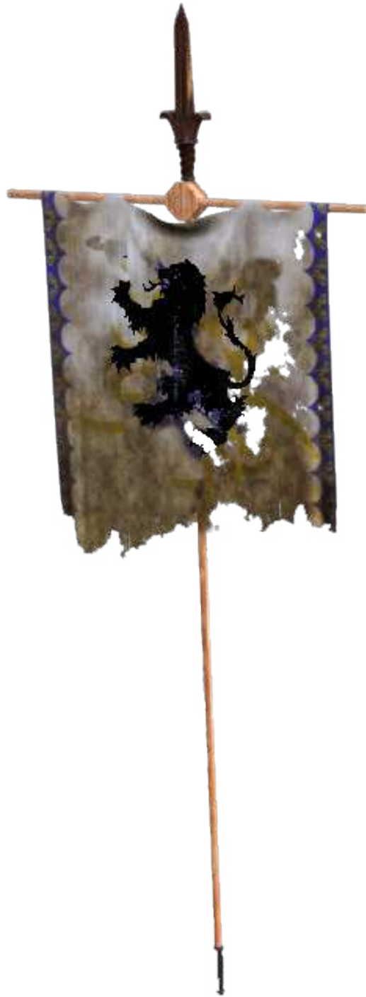
De vlag van Heer Gryyse