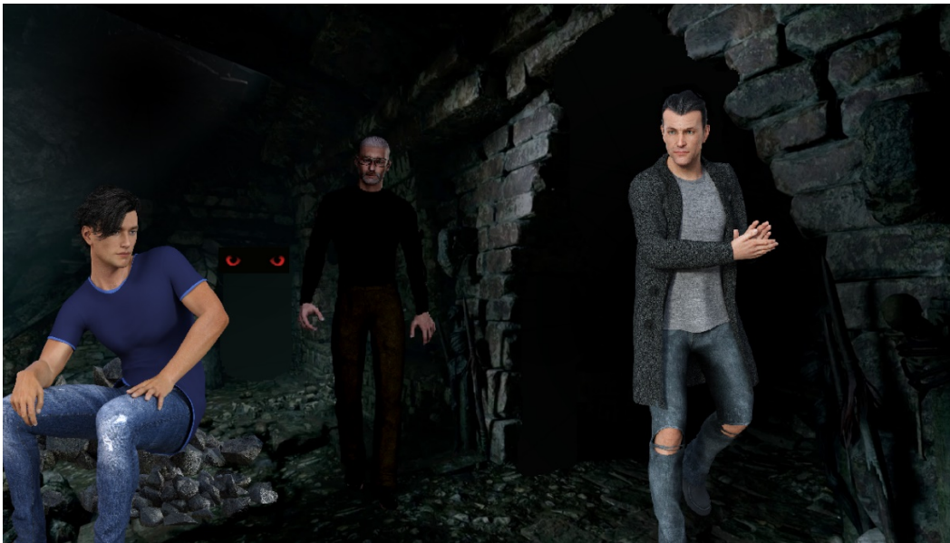
Dom, Doc en de aannemer

“Huh? Doc... waar is de aannemer? Is ie plots zomaar verdwenen?”, vroeg Dom geschrokken. Doc keek de rechercheur stomverbaasd aan. Wat was er met hem aan de hand? Zo raar heeft Dom nooit gereageerd. Een beginnende psychose? Laat dat niet waar zijn! De symptomen wijzen er echter wel op, meende de schouwartzs sip. “Maar jongen toch... je hebt de man zijn hand veel te lang vast gehouden en toen ik je dat zei, ontwaakte je plots en verontschuldigde je je hakkelerend tegenover die meneer. Ben je dat al allemaal vergeten? Niet normaal hoor. Ik ga je onderzoeken als we straks terug thuis zijn. Wat is er eigenlijk gebeurd dat je zo diep in jezelf verkeerde? Had iets jou in die toestand gebracht? Wat herinner je je nog?”, vuurde Doc een staccato van vragen af op zijn vriend. Maar die werd er nog verwarder van.