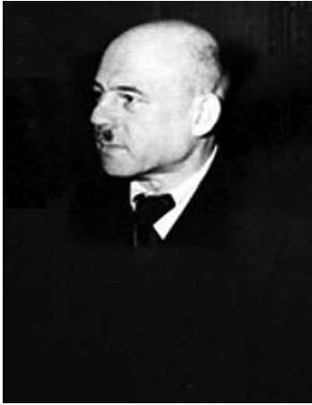
SS-Obergruppenführer Fritz Sauckel, minister van Arbeidsinzet en dwangarbeidersjager.

In de lente van 1943 draaiden de oorlogskansen om. Hitler verloor de slag om Stalingrad, waardoor hij zijn greep op de oliebronnen rond Baku verloor en de geallieerden begonnen hun systematische bombardementen boven Duitslands industriële steden. De schade die hierdoor werd teweeggebracht was enorm en de economie vertraagde opnieuw. Toch rolden in 1943 18,000 tanks van de band, maar de geallieerden produceerden in dat jaar 54,000 tanks. De VS, de Sovjet-Unie en Groot-Brittannië bouwden 4 keer meer vliegtuigen (34). Begin 1944 kondigde Goebbels de 'totalen Krieg' aan. Bedrijfsleiders werden onder druk gezet om de economische imperatieven slaafs te volgen. Wie