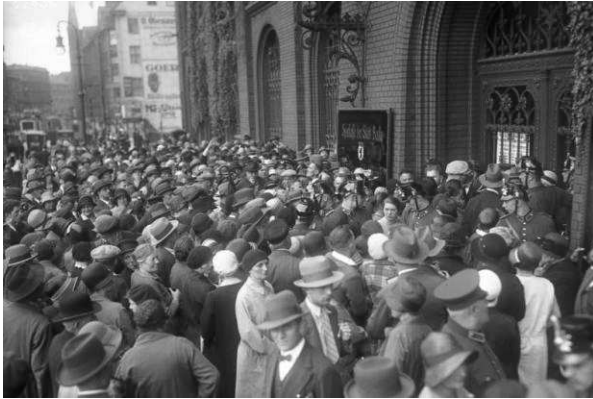
De bankrun op Credit Anstalt in 1931 in Berlijn.

voor een enorme schuldenberg. De stijging van de productie was niet geassocieerd met een stijging van de lonen, omdat er veel immigranten uit arme landen van Europa naar de VS emigreerden en bereid waren voor weinig geld te werken.