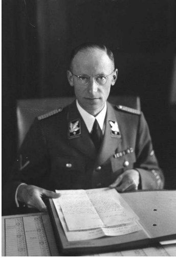
SS-Obergruppenführer Herbert Backe, bekend voor zijn 'Plan van de Honger'.