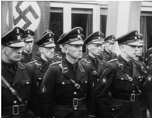
Leden van de Allgemeine SS in zwart uniform, zwarte laarzen, zwarte kepi, zwarte riem en met insignes op een zwarte achtergrond. Ook in het Italië van Mussolini droegen fascistten zwarte hemden.

Dit boek belicht de weg die nazi-Duitsland in de jaren '30 insloeg en die uitmondde in de gruwel van de Tweede Wereldoorlog en de Holocaust.