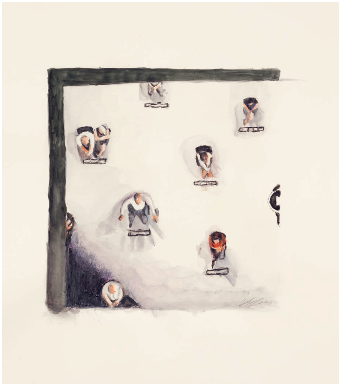
Intermission , 2020 51 x 49 cm Gouache on paper Private collection, Belgium