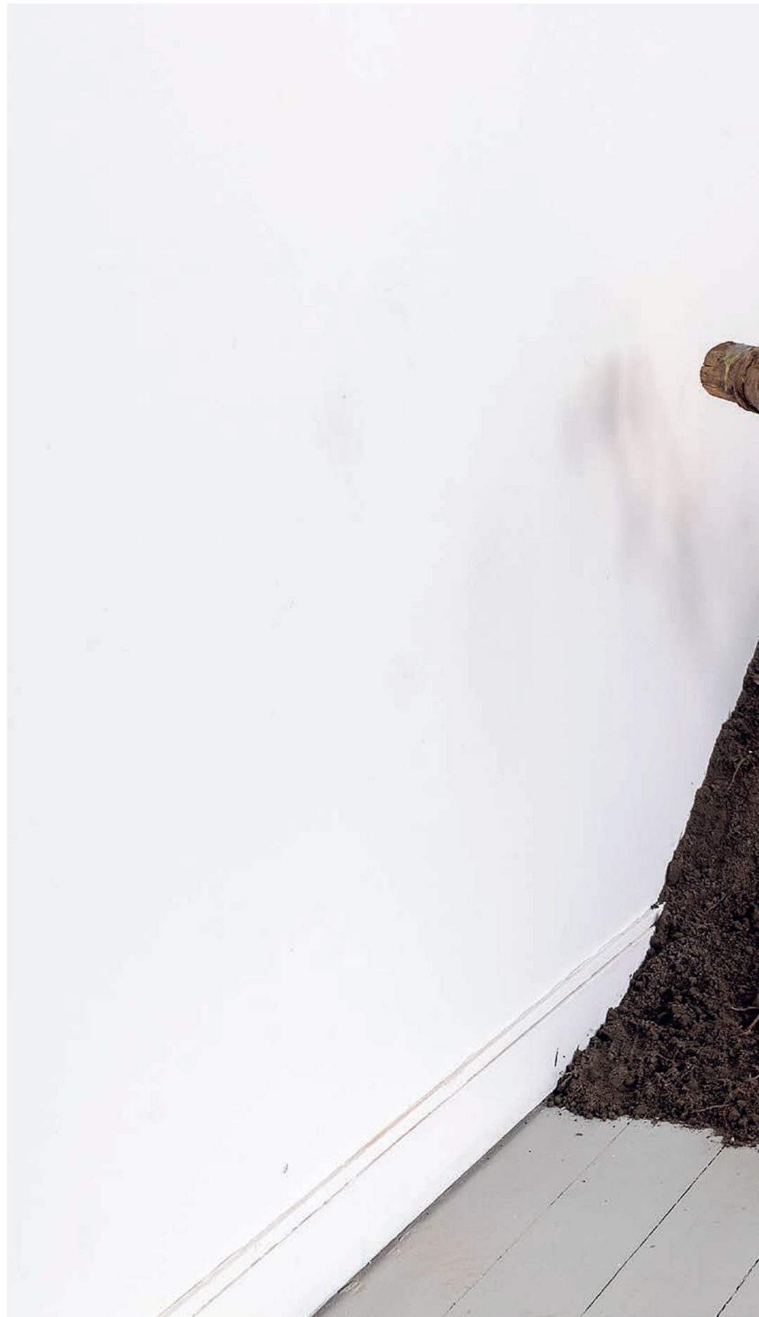
4 Step Shovel , 2015 176 x 20 x 25 cm Mixed media