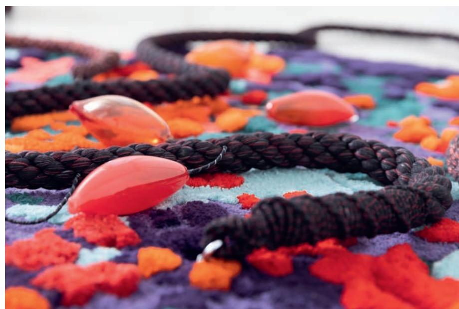
Silent Force, Red Caress, 2022 120 x 100 x 25 cm Hand-dyed wool, glass, wood, handmade cords, various elements