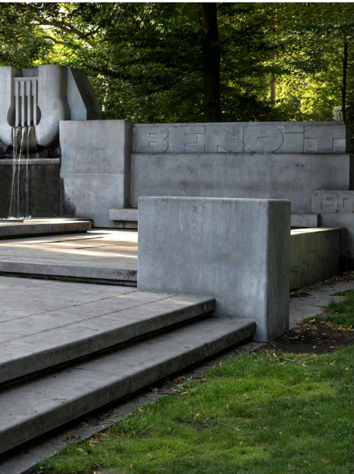
Zicht op het monument voor Peter Benoît in het Harmoniepark, ontworpen door Henry Van de Velde.