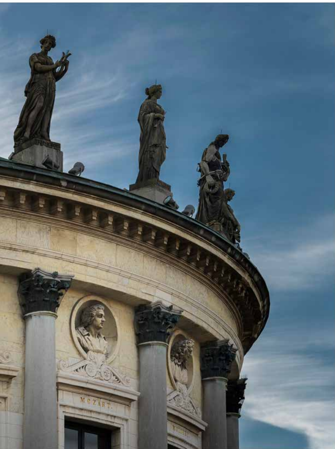
Zicht op de Bourlaschouwburg aan de Komedieplaats, waar het Théâtre Royal winterconcerten hield. Onder de kroonlijst staan niet alleen beroemde toneelschrijvers, maar ook verschillende componisten afgebeeld.