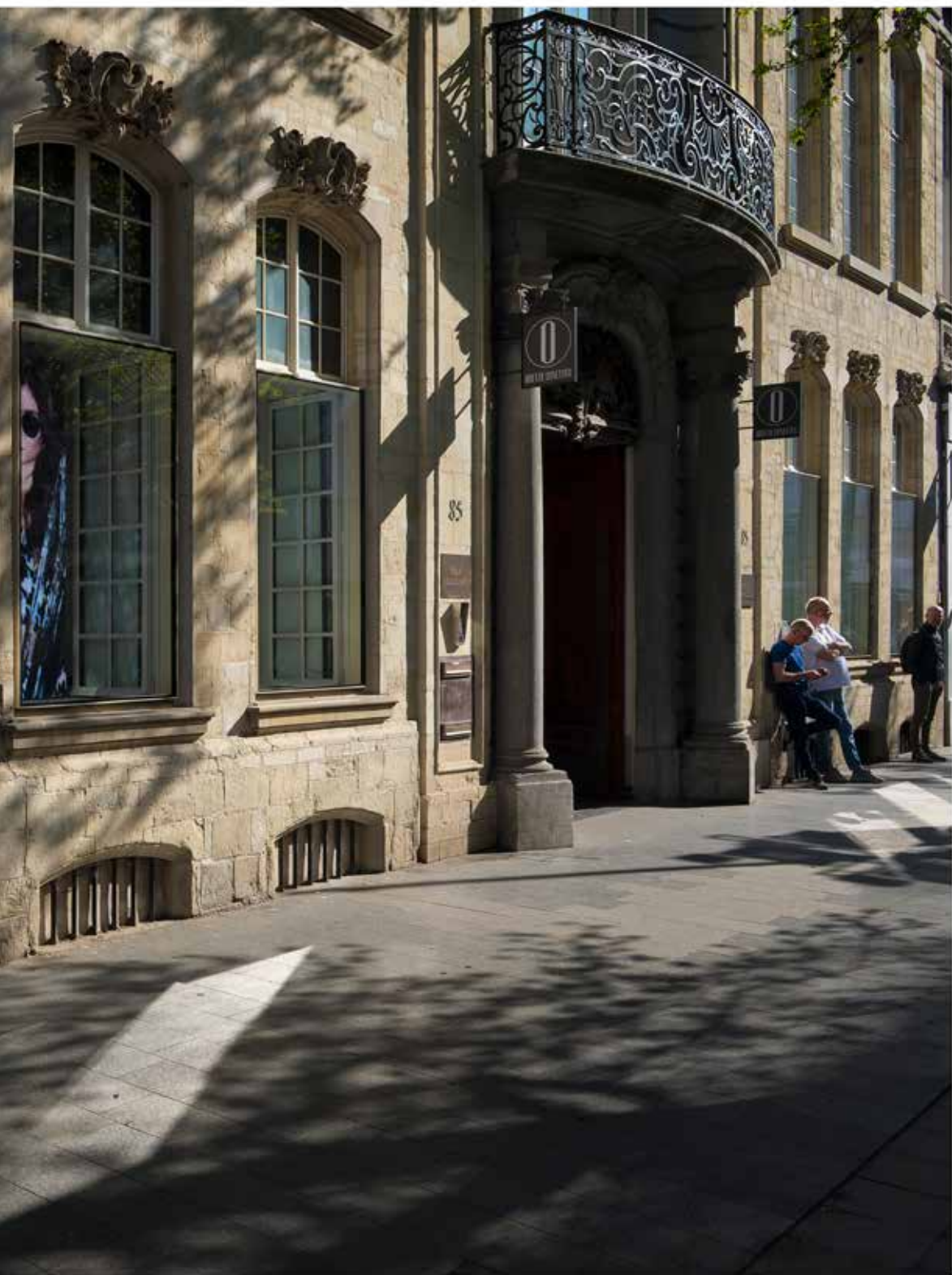
Het Osterriethuis aan de Meir, waar lange tijd intellectuele en muzikale salons gehouden werden.