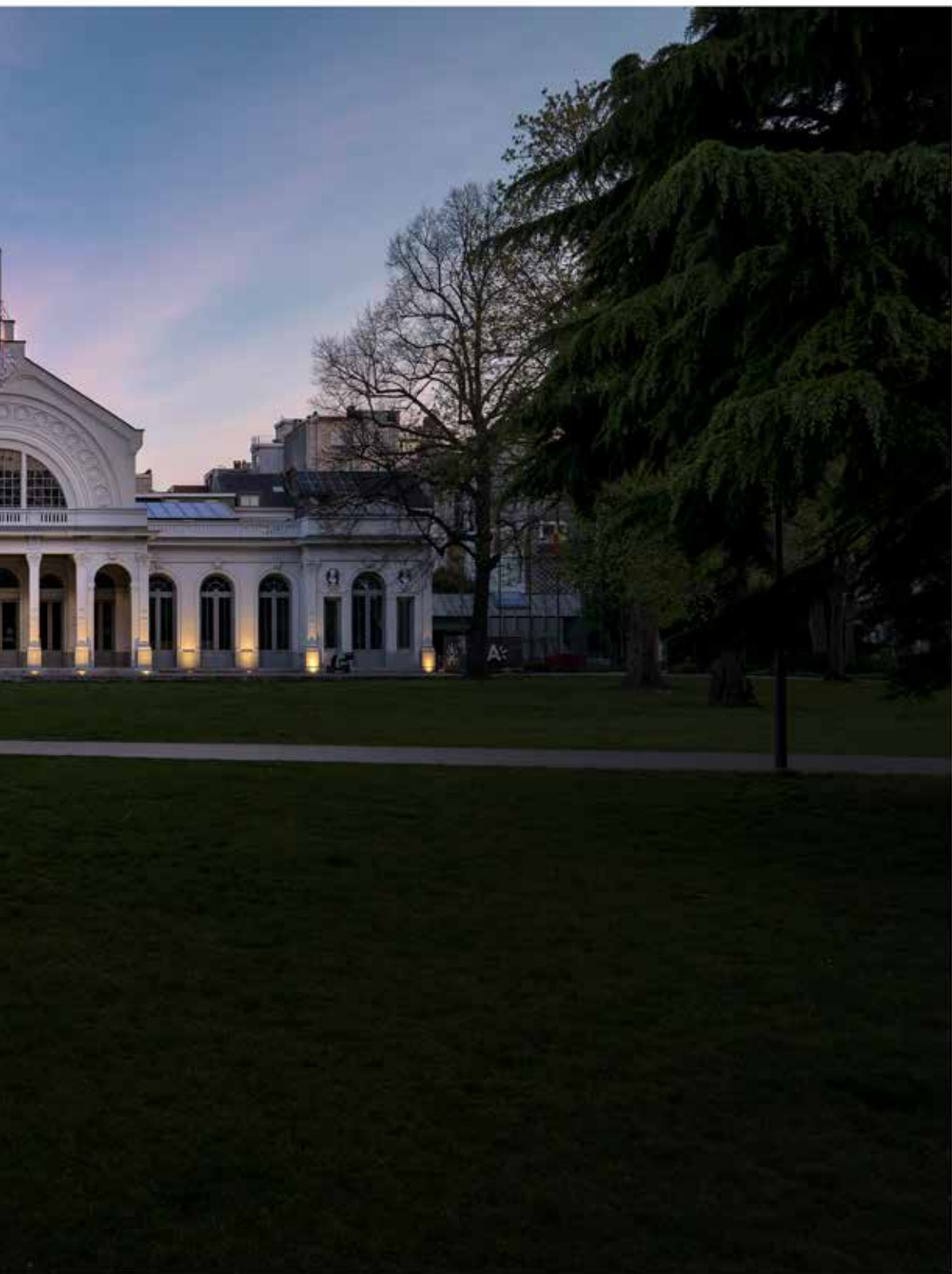
Het vroegere zomerlokaal van de Société royale d'Harmonie, gelegen in het Antwerpse Harmoniepark. Vandaag is hier het Antwerpse stadsloket gevestigd.