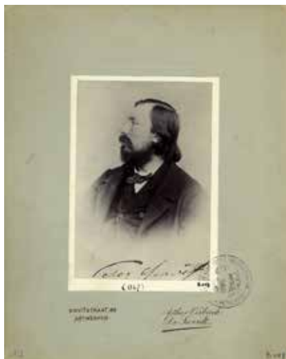
Peter Benoit in het jaar van zijn komst naar Antwerpen, 1867

Nottebohms... De Duitse gemeenschap had een grote invloed op het economische, sociale en culturele leven van Antwerpen. Ze was bijzonder zelfredzaam: ze had haar eigen cafés, restaurants en winkels, organiseerde haar eigen onderwijs, sociale hulpverlening, cultuur en ontspanning, ze gaf kranten uit en had haar eigen gebedshuizen. Maar ook buiten de eigen kringen namen de Duitsers als mecenas, organisator of actief lid deel aan het culturele verenigingsleven. De rol van de Duitse kolonie in het Antwerpse muzikaleven van de belle époque is moeilijk te overschatten. Dankzij haar inbreng pendelde Antwerpen muzikaal tussen de invloedssfeer van Parijs en de muziekcultuur uit het Rijnland. Die boeiende dynamiek zorgde voor een divers muzieklandschap met kleine en grote podia, twee operagezelschappen, een groeiend aantal concertverenigingen en orkesten, grootschalige muziekfestivals en openluchtconcerten. Er klonk muziek in cafés, koffiehuisen, danszalen en salons, op straten, pleinen en kiosken, en ook kerken waren muziekcentra voor oud én nieuw repertoire.