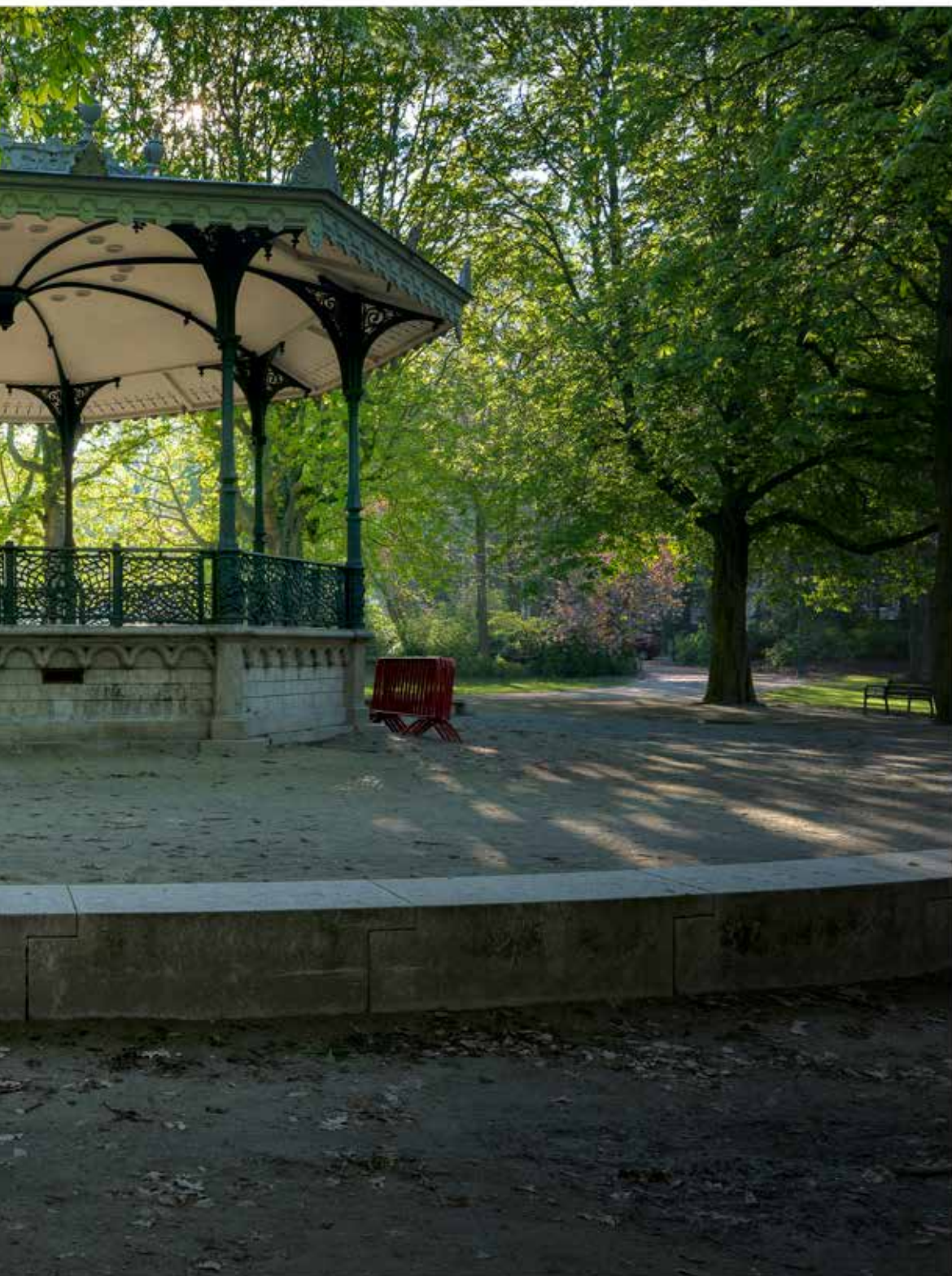
De muziekkiosk in het Koning Albertpark, vlak bij het vroegere zomerlokaal van de Soci t  royale d'Harmonie.