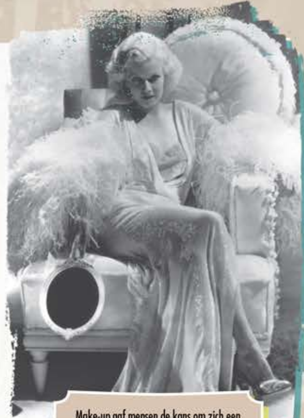
Make-up gaf mensen de kans om zich een klein beetje een ster te voelen, zoals de glamoureuze Jean Harlow.

Toen de wereld in de jaren dertig in een recessie terechtkwam, werd het leven voor veel mensen zwaar. Een van de populairste manieren om aan het echte leven te ontsnappen was een bezoekje aan de bioscoop. De aanblik van glamoureuze filmsterren met hun tot in de puntjes verzorgde make-up inspireerde vrouwen om zichzelf op schoonheidsproducten te trakteren. Door zulke kleine lichtpuntjes hielden ze de moed erin. In Londen werden in 1931 1500 keer meer lippenstiften verkocht dan tien jaar daarvoor!