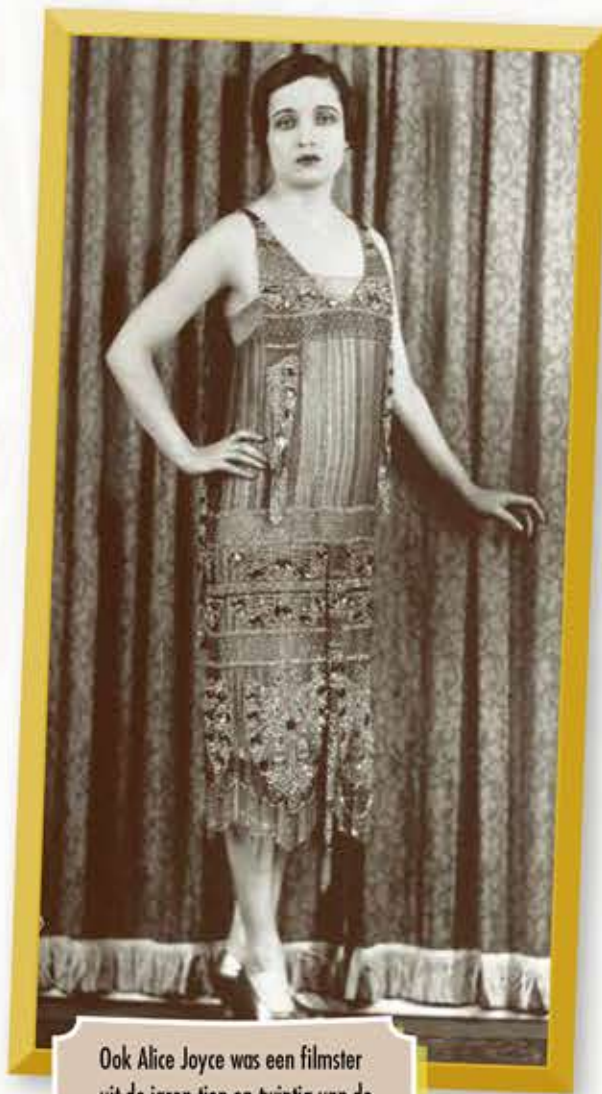
Ook Alice Joyce was een filmster uit de jaren tien en twintig van de twintigste eeuw.

Alles aan filmsterren was overvloedig – ook hun make-up. Sterren als Clara Bow en de Nederlandse Jetta Goudal droegen donkere make-up, met zwaar aangezette ogen en donkere, hartvormige lippen. Dat werkte goed op het scherm. Andere vrouwen probeerden deze look te imiteren. Ze gingen massaal naar de schoonheidssalons van nieuwe cosmeticabedrijven als Elizabeth Arden, Helena Rubinstein en Max Factor.