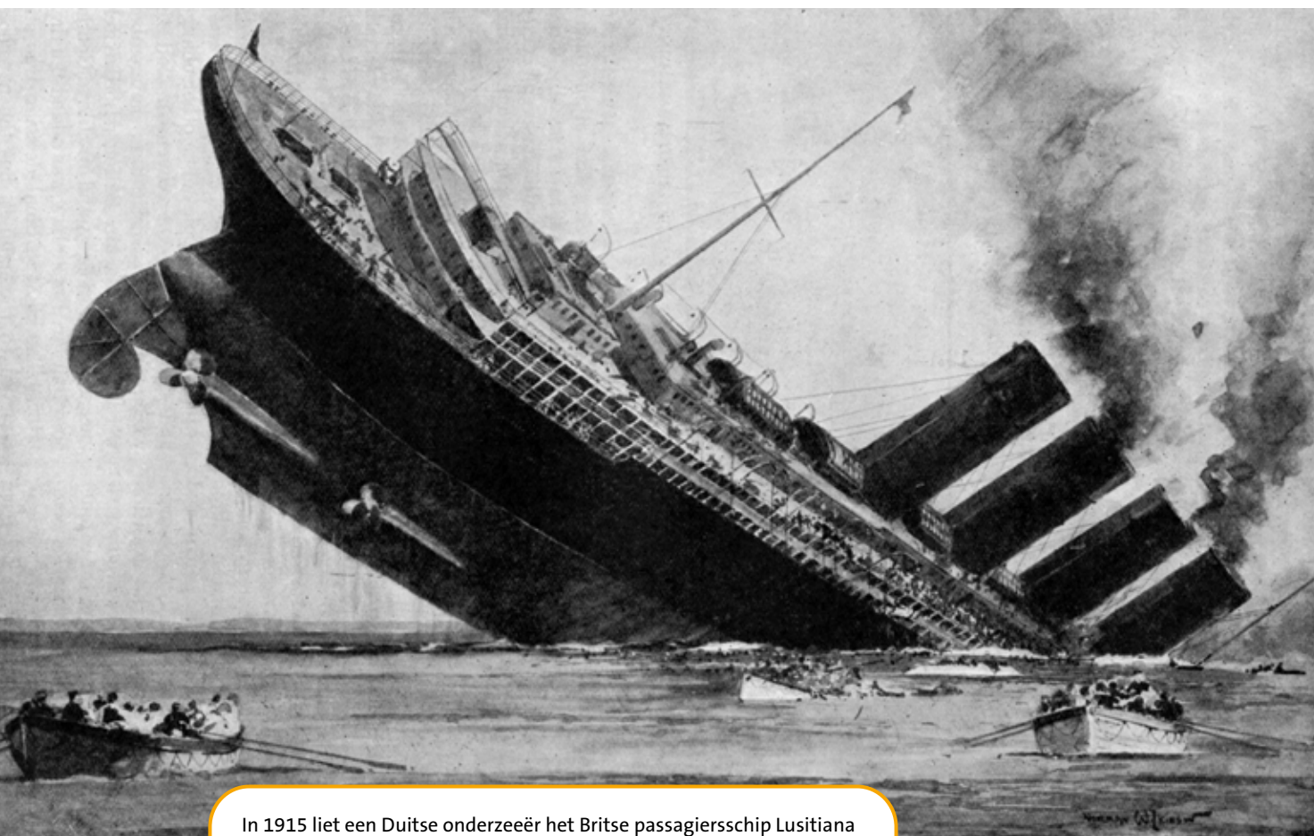
In 1915 liet een Duitse onderzeeër het Britse passagierschip Lusitania zinken. Bijna 1200 mensen kwamen om, waaronder 128 Amerikanen.

De Eerste Wereldoorlog werd voor een groot deel uitgevochten in Europa. Daar waren verschillende fronten. Een front is de plaats waar twee legers tegenover elkaar staan. Langs het front legden beide partijen loopgraven aan: smalle gangen in de grond, waarin de