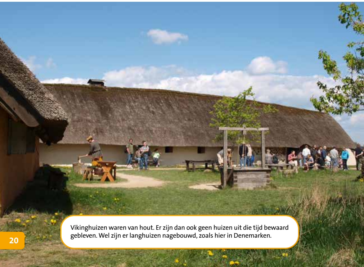
Vikinghuizen waren van hout. Er zijn dan ook geen huizen uit die tijd bewaard gebleven. Wel zijn er langhuizen nagebouwd, zoals hier in Denemarken.