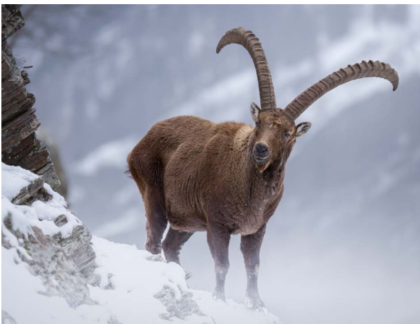
Een steenbok leeft hoog in de bergen. Daar kan het hard vriezen en sneeuwen. Maar zijn dikke vacht is een warme jas.

Jij voelt met je huid. Dat doet een dier ook. Sommige dieren kunnen zelfs ademen door hun huid.