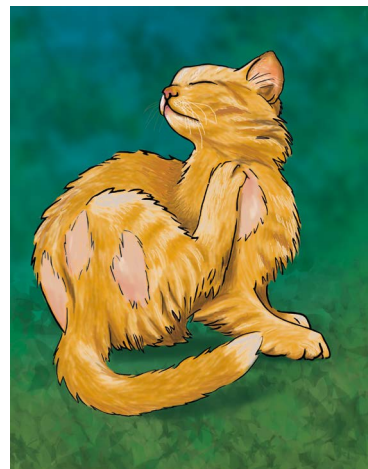
Deze poes is ziek. Dat zie je aan de kale plekken op zijn huid.