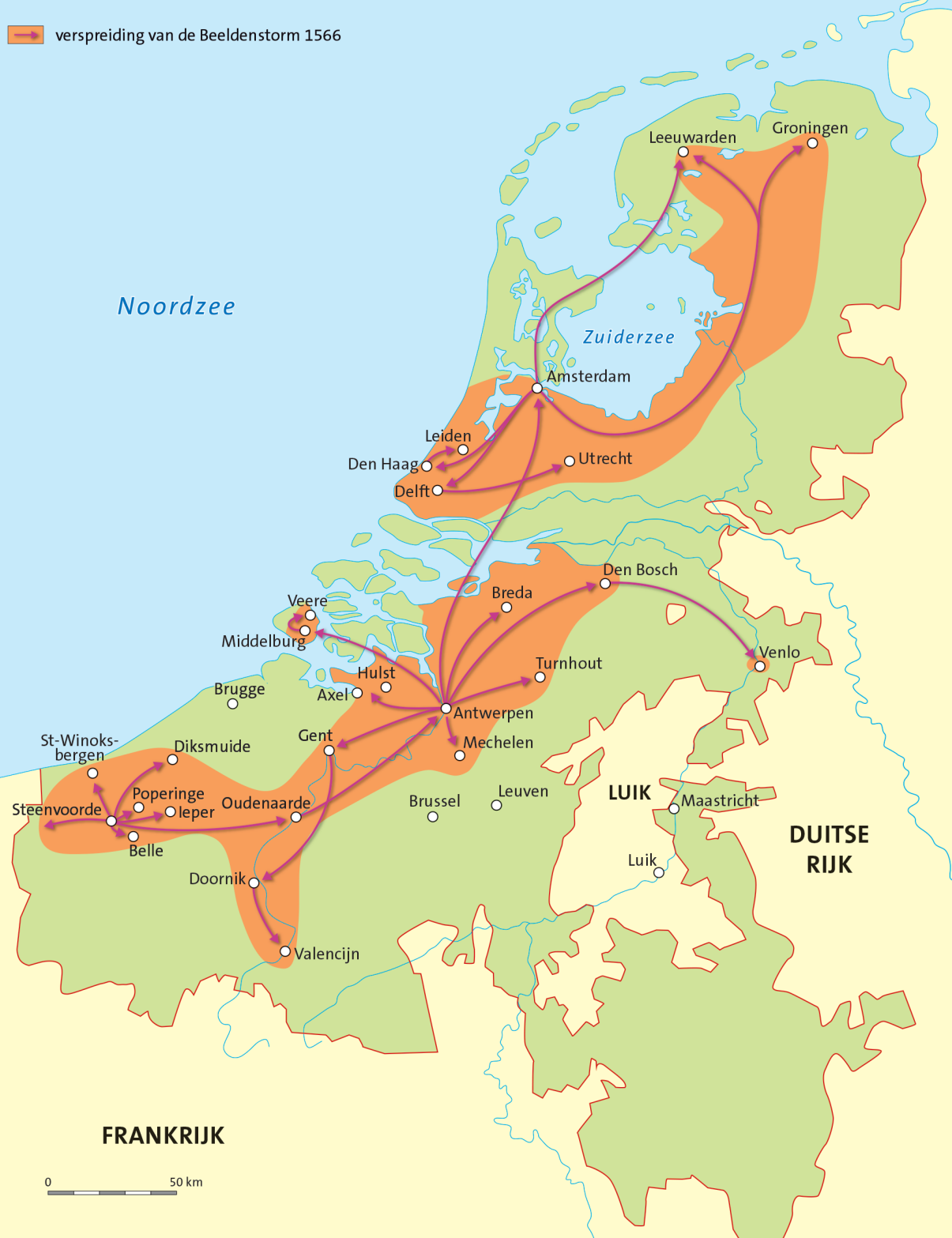
De Habsburgse Nederlanden onder Karel V en Filips II in de 16e eeuw. De pijlen geven de route van de Beeldenstorm aan.