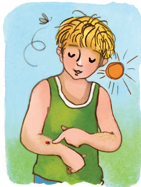
Haartjes helpen je een beetje met voelen.

Wist je ... dat je over je hele lijf haar hebt? Alleen niet op je lippen, je voetzolen en de binnenkant van je handen.