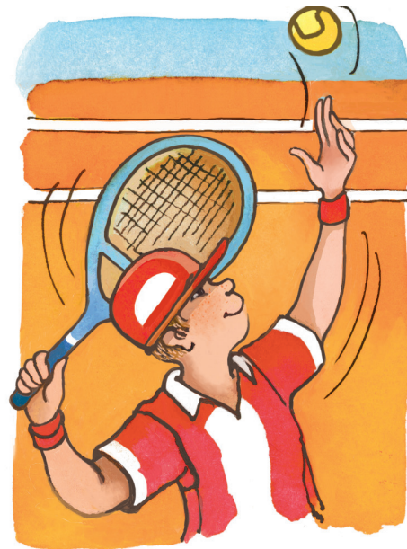
Weinig of dun haar op je hoofd? Gelukkig zijn er petten en mutsen!

Ook de haartjes op je gezicht zijn handig. Je wenkbrauwen zorgen dat zweet van je voorhoofd niet in je ogen komt. Dankzij je wimpers komen er geen vuiltjes uit de lucht in je ogen. In je neus zitten ook haartjes. Die houden stof en ziektekiemen tegen. Daardoor word je minder snel verkouden.