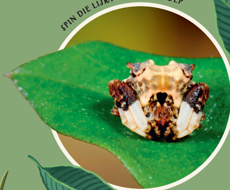
SPIN DIE LIJKT OP VOGELPOEP

Camouflage draait niet alleen om uiterlijk, toneelspelen hoort er ook bij. Met zijn gestreepte veren valt een roerdomp helemaal weg in het riet. En als hij een roofdier spot, steekt hij zijn snavel in de lucht en blijft staan als een rietstokje. En waait het? Dan deint hij zelfs zachtjes heen en weer!