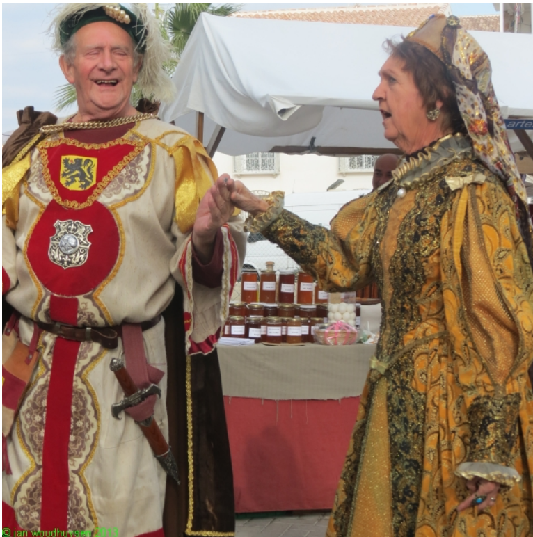
De graaf en gravin van Vlaanderen

We kijken met veel plezier terug op die tijd. Dankzij de Middeleeuwen hebben we grote stukken van Spanje kunnen ontdekken. Je staat verstelt als je ziet hoeveel middeleeuwse gebouwen overeind staan.