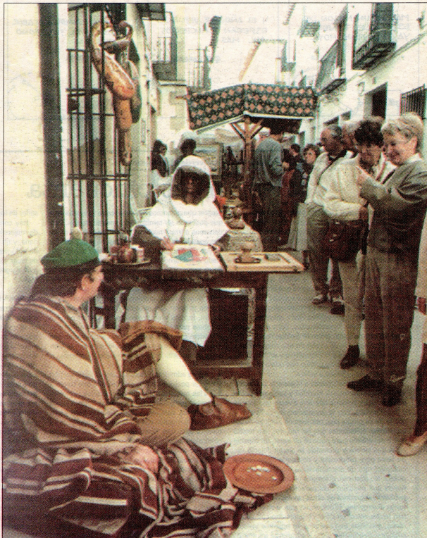
■ CON SABOR MEDIEVAL. El casco antiguo de Benissa es escenario este fin de semana de una feria medieval que recrea el ambiente típico de los mercados celebrados en distintas ciudades europeas en la Edad Media. El zoco ha sido instalado en la calle Purísima, un largo y estrecho vial que atraviesa el casco histórico del municipio, desde el antiguo hospital que en la actualidad alberga la Casa Consistorial, hasta la plaza de Jaume I. La feria, la primera de su tipo celebrada en Benissa, pone el broche de oro a la Fira i Porrat de Sant Antoni. ■■ Página 6