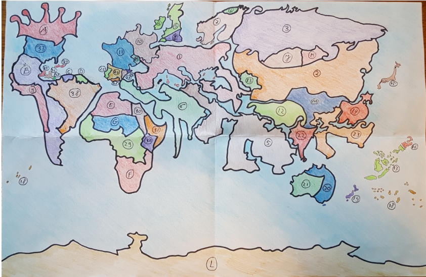
Wereldkaart 1 - Schematische (nog steeds zeer slordige en onduidelijke) kaart van de wereld waarin de verhalen "De vloek van Romnor", "De choreografie van Alfar" en "Vodun veves" zich afspelen.