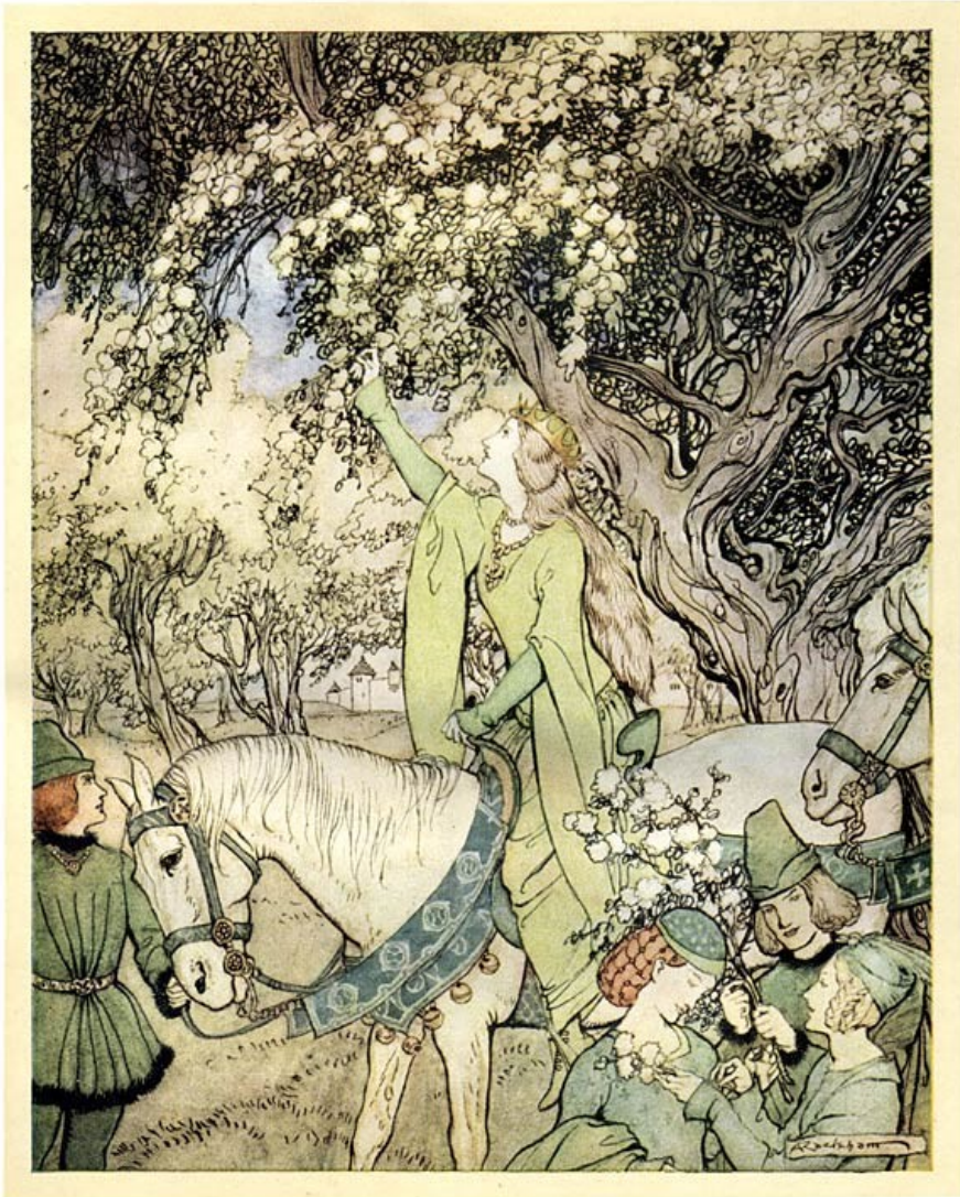
Koningin Ginevra op weg naar haar toekomstige echtgenoot.

ridders genadig haar de handkus liet geven.