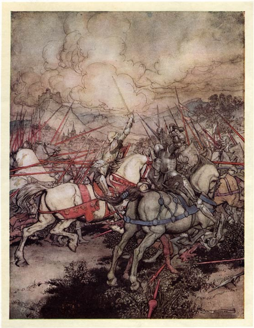
Koning Arthur gebruikt voor het eerst zijn zwaard Excalibur.