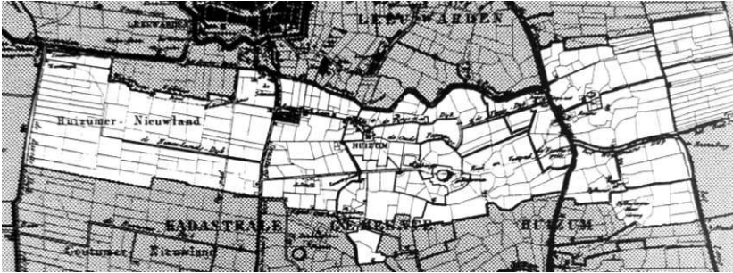
Het Huizumer dorpsgebied na de inpoldering van de Middelzee.

Middelzee; het middelste deel was vanouds het meest bewoonde gebied met de grote terpen van Huizum en Mellens; 5 aan de oostkant liep het gebied over in het lage midden van Friesland.