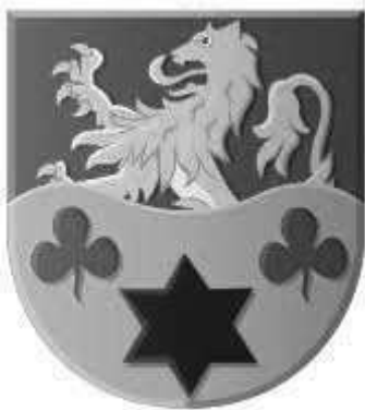
Wapen van Huizum