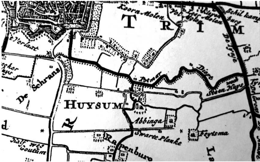
Huizum in 1543 (kaart Jacob van Deventer):