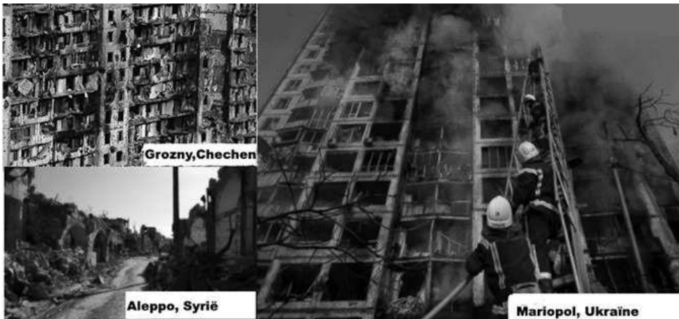
Figuur: De Russische strategie tegen de burgerbevolking: linksboven: Grozny, Chechenye, links onder: Aleppo, Syrië, Rechts: Mariopol.

Dat was de Russische strategie in Tsjetsjenië, waar de Russen een groot deel van de bevolking hebben uitgemoord. Grozny, de hoofdstad, stond bekend als: " de meest verwoeste stad op aarde ". Hetzelfde hebben ze gedaan in Syrië, om hun marionet Assad, is stand te houden. Ook Syrische steden werden totaal verwoest en scholen en ziekenhuizen gebombardeerd. Hetzelfde doen ze nu (april 2022) in Oekraïne.