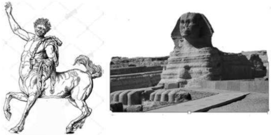
Figuur boven links: een centauer uit de Griekse mythologie; figuur rechts: Sfinx, chimaera uit Egypte.

Dat geldt dan in het bijzonder voor een chimeervirus. Een chimaera organisme is een organisme dat is samengesteld uit de onderdelen van andere organismen. Voorbeelden andere organismen uit de oudheid zijn de centaur (paard met mensenhoofd), de sfinx (leeuw met mensenhoofd), Pegasus (paard met vleugels).