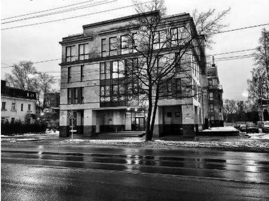
Figuur: Eén van de kantoren van waar uit het Russische trollenleger wordt aangestuurd, Savushkina Street 55 in Sint Petersburg, Rusland.

rechtse anti-immigratie groepen, zoals Le Pen in Frankrijk. Ook de opstand van de Gele Hesjes was vanuit het Kremlin georkestreerd. (In Frankrijk gaat dat al heel makkelijk, omdat de grootste vakbond, de CGT, is opgezet door communisten die trouw aan Rusland hebben gezworen). Als er maar onrust en conflict is.