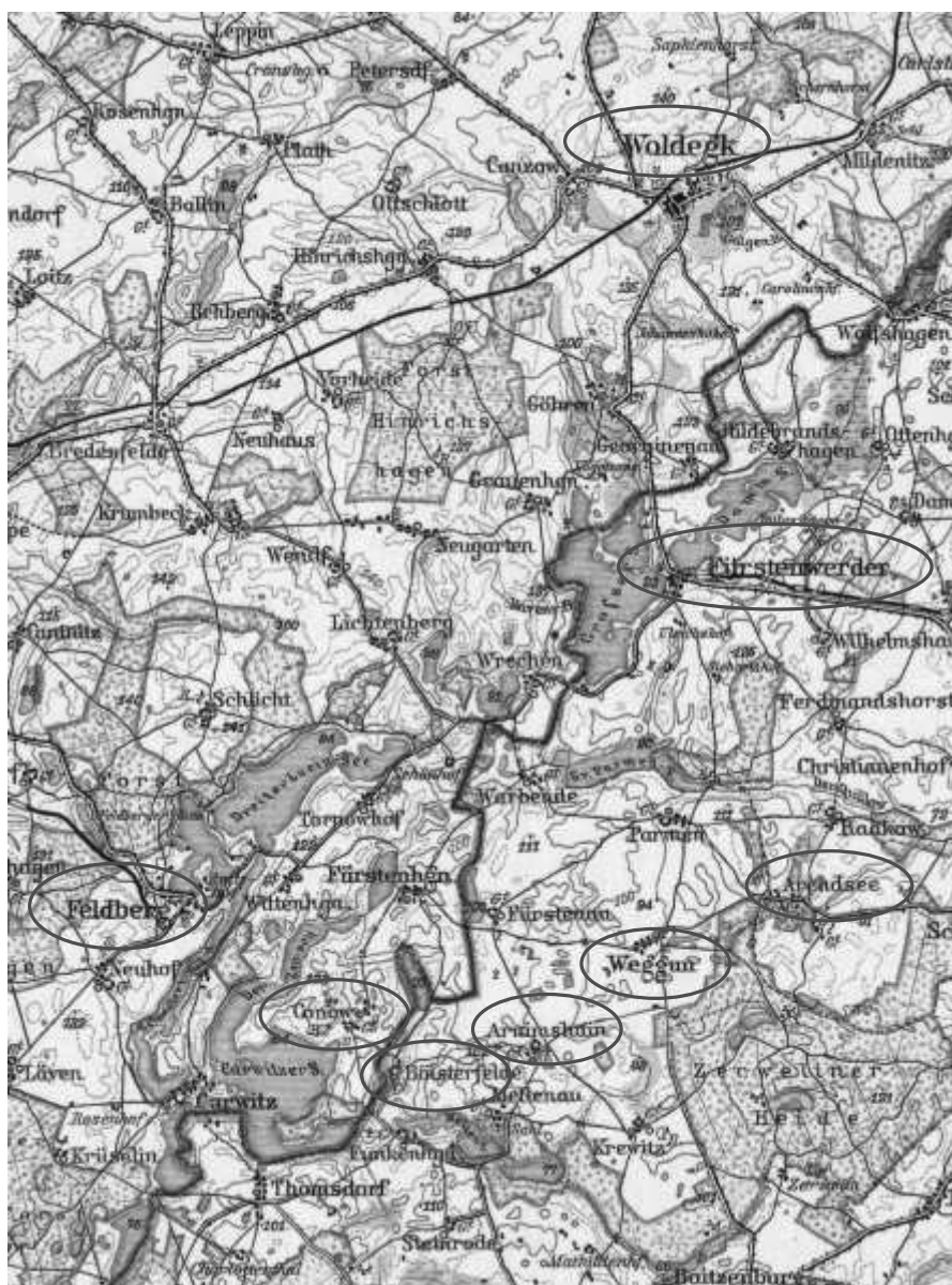
Kaart met de omgeving van Prenzlau met het jachtgebied.