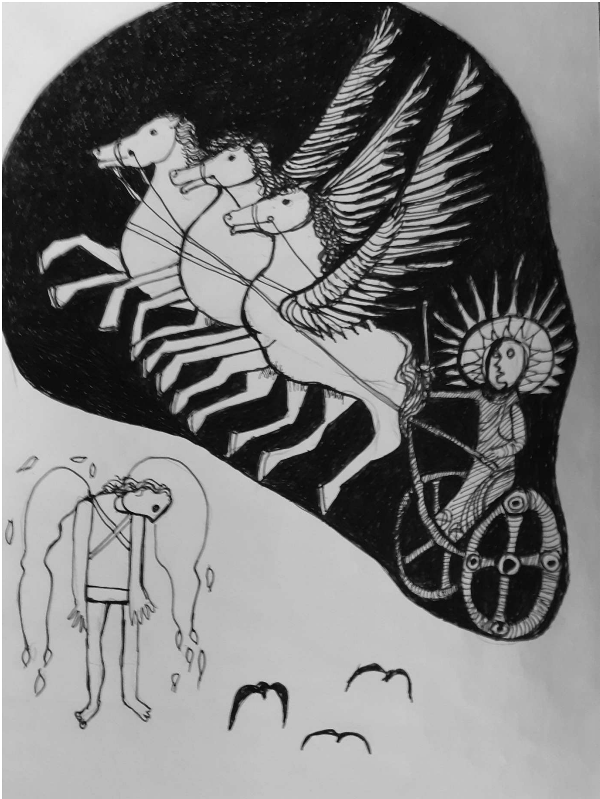
Helios verbrandt de vleugels van Icarus