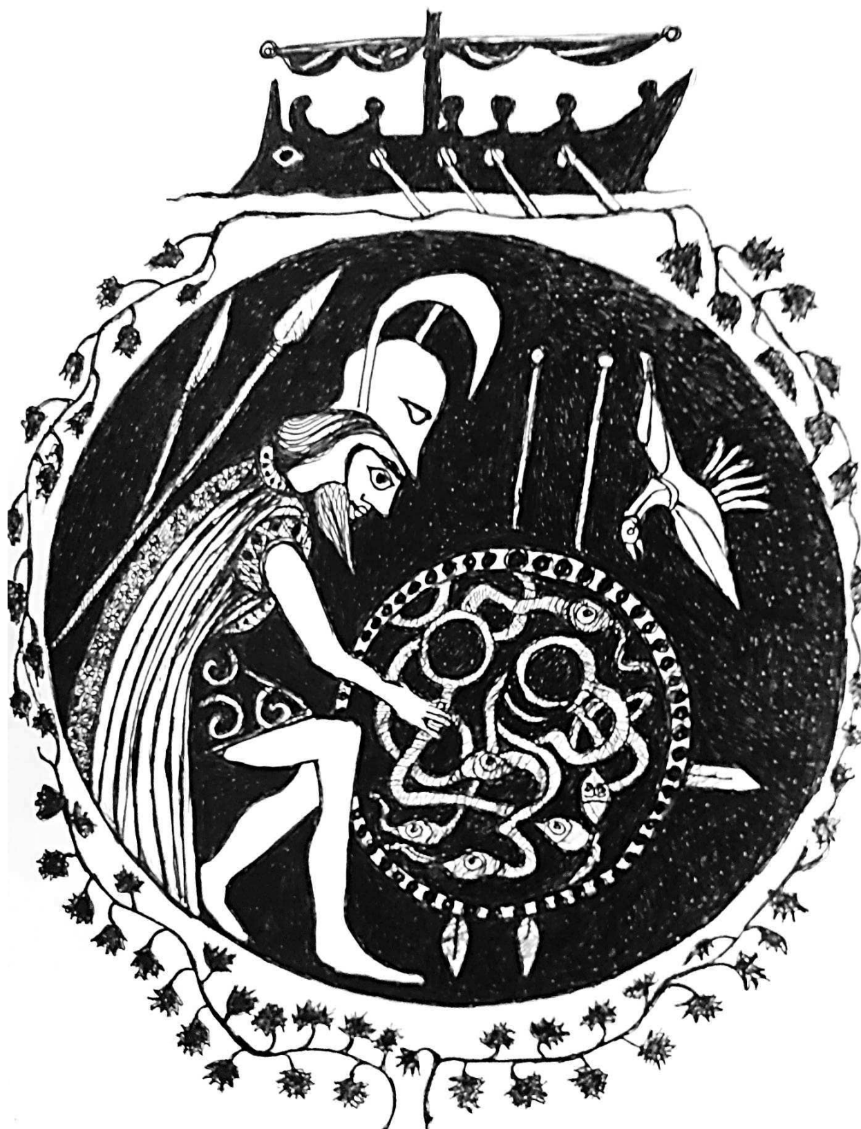
Achilles kijkt naar zijn wapenuitrusting