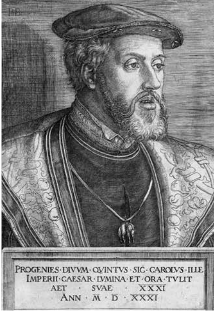
Afb. 1 Portret van Karel V, Barthel Beham, Rijksmuseum Amsterdam.

en schakelde daarvoor de hoge edelen uit de verschillende gewesten in. Zij moesten hem als leden van de Grote Raad naast de vorst adviseren. 2