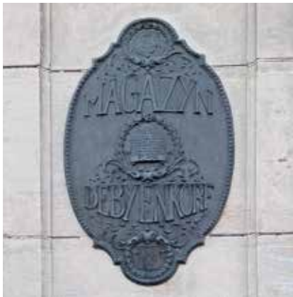
Het oude logo van de Bijenkorf.