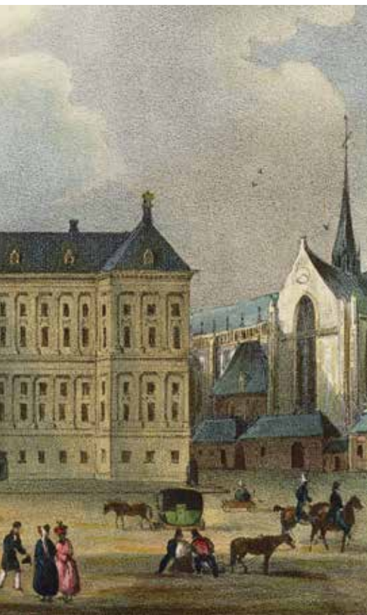
Het Paleis op de Dam rond 1810.