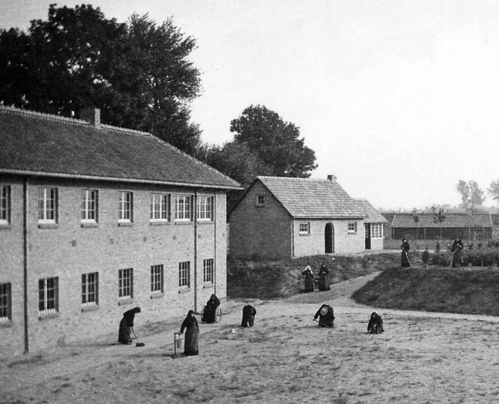
🌿 'Pioniersarbeid in de grote tuin', aldus het oorspronkelijke bijschrift van deze foto uit 1939. Net als bij andere kloosters droegen de muren om het Gemmaklooster bij aan het behoeden van de stilte. 'Als jullie bidden, trek je dan terug in je huis, sluit de deur en bid tot je Vader in het verborgene' (Mattheüs 6: 6).