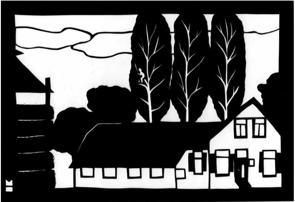
Afb. 1 Boerderij Atteveld, Kees kijkt over de velden, 21 x 14 cm (origineel papierknipwerk in silhouetepapier door Maja Houtman, 2023).

den – een notaris – vaak naar Utrecht. Daarentegen bood de handel in en het transport van elzenhakhout een groot aantal schippers en houtkopers een bestaan. De daghuurders vormden de sociaal zwakste bevolkingsgroep, hoewel ook binnen deze groep enige variatie bestond.