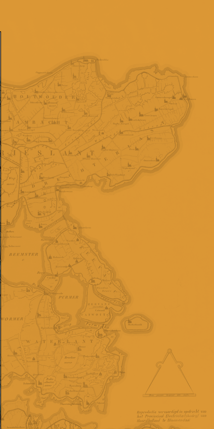
Reproductie vervaardigd in opdracht van het Provinciaal Electriciteitsbedrijf van Noordholland te Bloemendaal