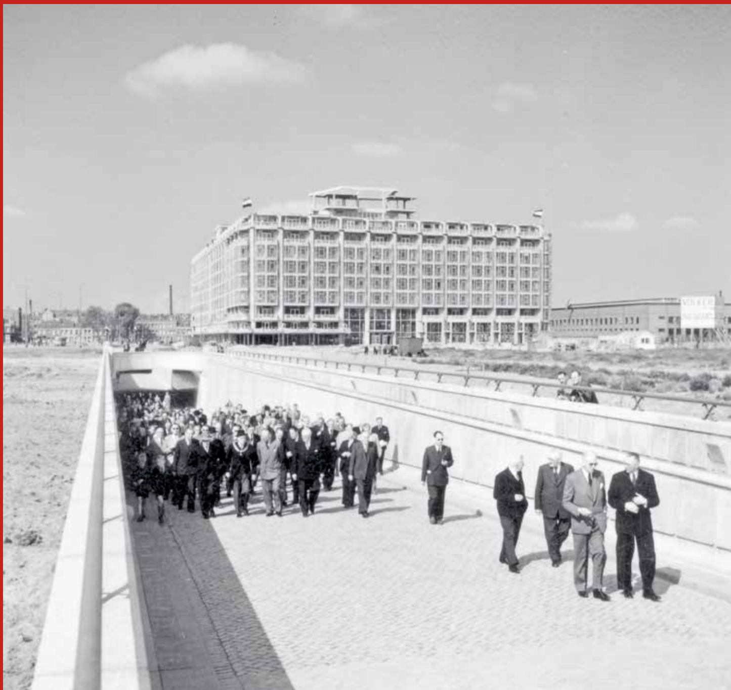
Groothandelsgebouw, Stationsplein 45, Rotterdam (1945-1952) bij de opening van de Weentunnel, 1952.