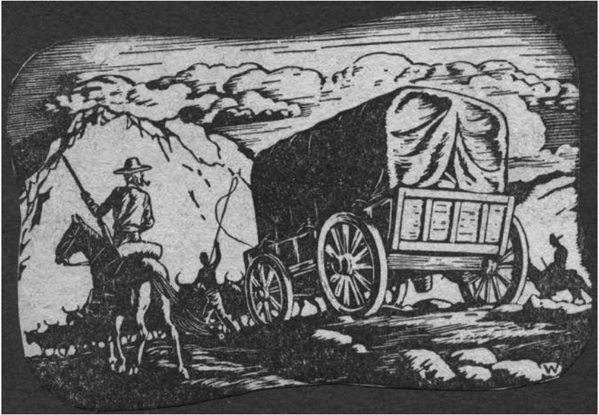
Voortrekkers op trekpad (tekening omstreeks 1935; collectie Zuid-Afrikahuis).