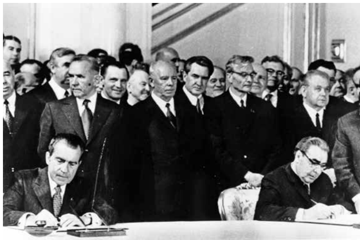
De Amerikaanse president Richard Nixon en de Sovjet-leider Leonid Breznev ondertekenen een wapenreductieverdrag, 1973.

De Koude Oorlog eindigde uiteindelijk met de val van de Berlijnse Muur op 9 november 1989 en de ineenstorting van de Sovjet-Unie in 1991. Deze gebeurtenissen markeren het einde van een tijdperk van grote internationale spanningen.