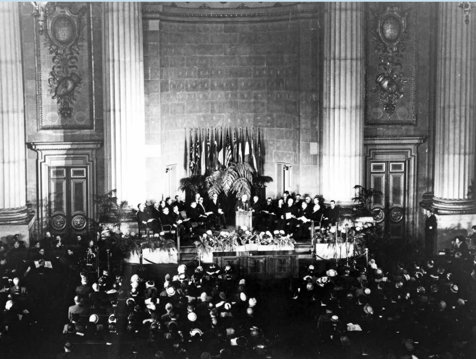
Ondertekening van het Noord-Atlantische Verdrag in Washington D.C., 4 april 1949.