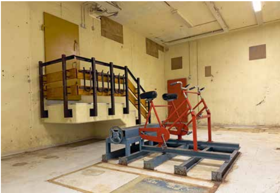
Luchtbehandelingsruimte in het Nucleair Chemisch Onderkomen van de PTT.

Alkmaar heeft een zeer interessante verzameling erfgoed van de Koude Oorlog, die een goed beeld schetst van deze vergaande voorbereidingen op een mogelijke Derde Wereldoorlog. Daarover vertelt dit boek.