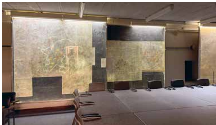
Kringcommandopost van de Bescherming Bevolking in Breda, gelegen aan de Doelen 11, Breda.