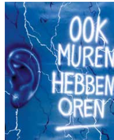
Boven, de Berlijnse Muur had een enorm effect op de persoonlijke belevingswereld van de bewoners.

nieuwe vernietigende wapens, ideologische confrontaties, spionage, een voortdurende dreiging met het gebruik van atoomwapens en een allesvernietigende nucleaire oorlog. Zowel in het westen als in het oosten werden daarop vergaande stappen genomen ter voorbereiding op een nieuwe wereldoorlog. Dit waren maatregelen om burgers te beschermen, de maatschappij in staat te stellen om te blijven functioneren tijdens en na een aanval en de verdediging van het land te waarborgen. Dreigingen over en weer tussen de machtsblokken leidden tot hoogoplopende spanningen in de wereld, waarbij de wereldbevolking een aantal keer dacht dat het einde van de mensheid op deze aarde nabij was. Die dreiging werd bijvoorbeeld gevoeld in 1948, toen de Sovjet-Unie West-Berlijn afsloot waardoor het Westen slechts via een luchtbrug voedsel kon leveren aan de bevolking van West-Berlijn. Ook in 1962 tijdens de Cubacrisis, toen de Sovjet-Unie dreigde om kernraketten op het communistische eiland Cuba te plaatsen, vlakbij de Verenigde Staten, werd diezelfde dreiging voelbaar.