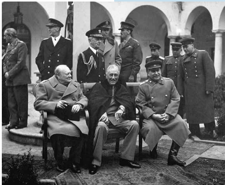
Churchill, Roosevelt en Stalin poseren voor de pers tijdens de conferentie van Jalta, 1945.

Samen met elf landen, 1 waaronder Nederland, richtten de Verenigde Staten in 1949 de Noord-Atlantische Verdragsorganisatie (NAVO) op, gebaseerd op gemeenschappelijke verdediging. Om sterker te staan tegenover hun gezamenlijke vijand spraken de westerse landen hierin af dat als één van hen zou worden aangevallen de anderen zullen helpen in de verdediging tegen de agressor. De Sovjet-Unie en zeven Oostbloklanden 2 deden hetzelfde en verenigden zich in het Warschaupact. Deze werd op 14 mei 1955 opgericht door Nikita Chroesjtsjov (1894-1971), de opvolger van Jozef Stalin (1878-1953), leider van de Sovjet-Unie.