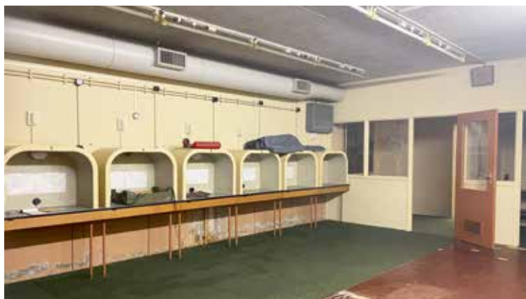
Provinciale commandopost van de Bescherming Bevolking in Holten, Overijssel.

In de jaren '50 en '60 besefte Nederland, aangemoedigd door de Verenigde Staten, dat het zich nog beter moest voorbereiden op een mogelijke nieuwe wereldoorlog. De Derde Wereldoorlog zou nog vernietigender zijn door het gebruik van atoomwapens. De atoombom kenden we al van het einde van de Tweede Wereldoorlog: de atoombommen op Hiroshima en Nagasaki. Maar de ontwikkeling van de atoomwapens ging door tijdens de Koude Oorlog. De krachtigste atoombom was de Tsar Bomba van 50 tot 58 megaton, ontwikkeld door de Sovjet-Unie en in 1961 tot ontploffing gebracht boven de afgelegen eilandengroep Nova Zembla. Naar verluidt was deze zo'n 3300 keer krachtiger dan de atoombommen die waren gebruikt op Hiroshima en Nagasaki. De vernietigende kracht ervan was zo enorm dat die nauwelijks voor te stellen is.