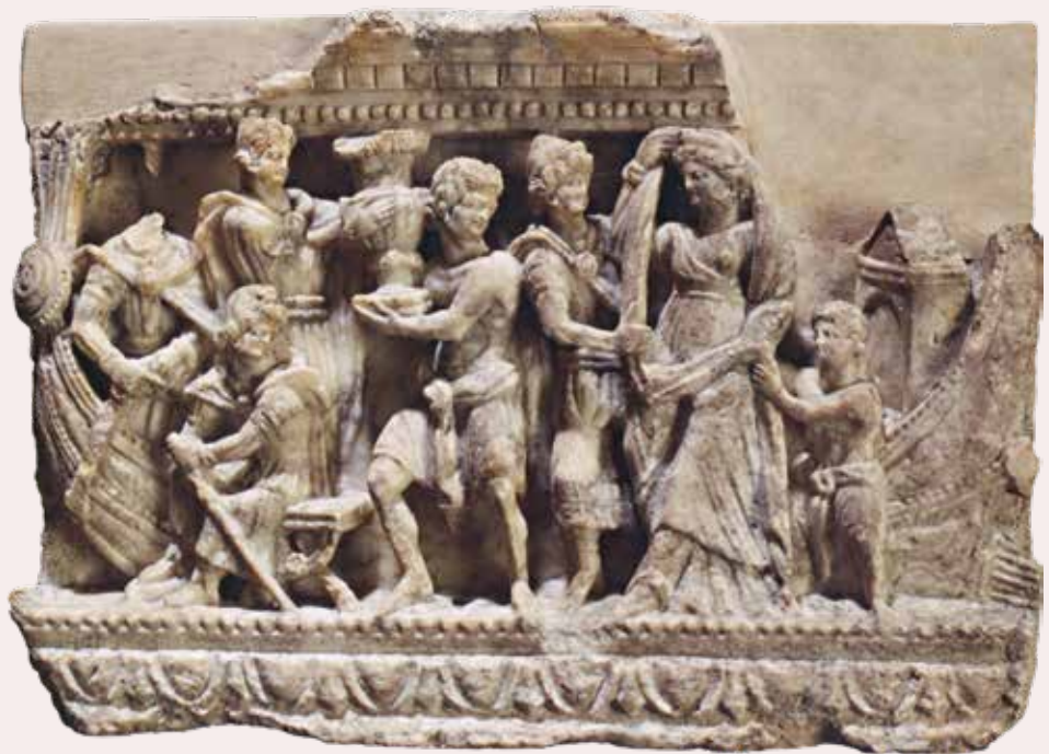
Inschepping van Helena British Museum