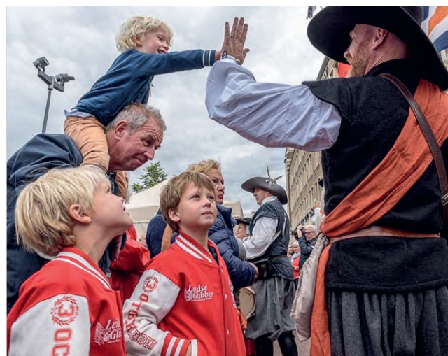
Kinderen verwelkomen de geuzen bij hun jaarlijkse intocht voorafgaand aan de inschrijving voor haring en wittebrood, september 2019.

Iconische topstukken zijn te bewonderen in Museum De Lakenhal, zoals de legendarische hutspot en het enorme schilderij waarop burgemeester Van der Werf heldhaftig zijn eigen lichaam te eten aanbiedt aan de hongerende bevolking. In de stad herinneren meerdere straatnamen aan personen die een rol speelden tijdens het beleg, zoals de Van der Werfstraat en de Jan van Houtkade.