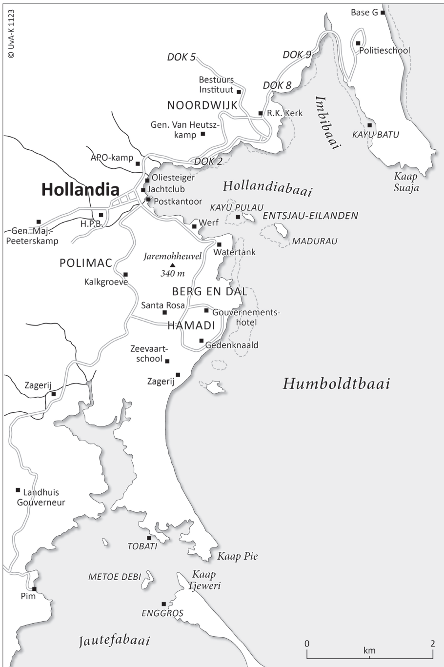
Kaart 1 De stad Hollandia