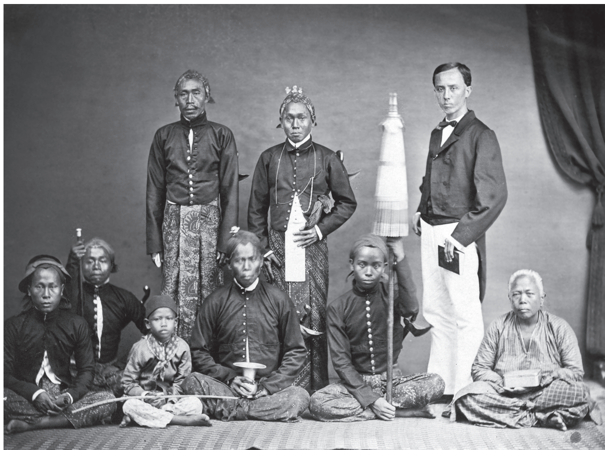
Regent met gevolg. De naam van deze gefotografeerde regent en zijn familie is onbekend.