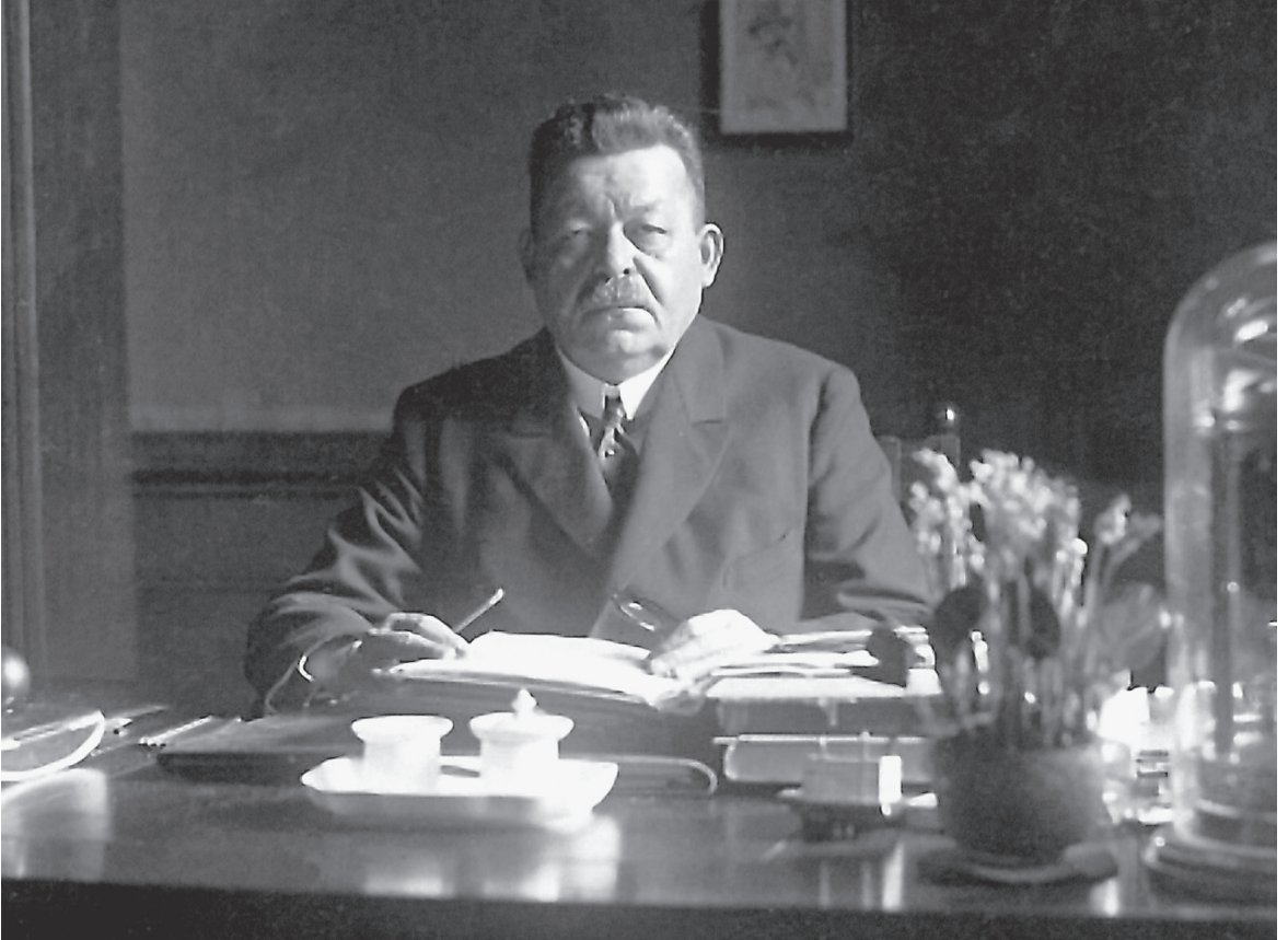
Friedrich Ebert (1871-1925), voorzitter van de 'Rat der Volksbeauftragten' en vanaf 11 februari 1919 rijkspresident van de Weimarrepubliek