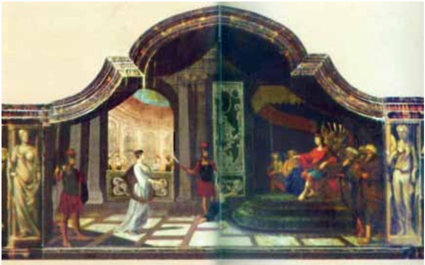
J.J. (Jacob) de Nijs, Salomo's oordeel , olieverf op paneel, drieliuk met een middenstuk van 2,7 meter, ca. 1725. Dit werk bevond zich in het oude stadhuis te Batavia en was deel van de Indische Landsverzameling. Het is na de onafhankelijkheid achtergebleven in Indonesië. © Indische Landsverzameling/Rijksdienst Cultureel Erfgoed, Museum Sejarah Jakarta, inv.nr. MSJ-09.

ren. Zo bevindt zich op onverklaarbare wijze het grote olieverfschilderij met gouverneur-generaal Petrus Albertus van der Parra (1762) in het Museum Sejarah te Jakarta. Dit werk is afkomstig uit particulier bezit van de Indo-Europese plantersfamilie Ament die van deze 'herontdekking' niet op de hoogte was. Overigens bevinden zich in dit museum nog meer olieverfportretten uit de koloniale tijd waarvan de herkomst onduidelijk is. Verder bleef een triptiek door J.J. (Jacob) de Nijs, met een middenstuk van 2,7 meter, met een Bijbels tafereel voorstellend Salomo's oordeel uit de vroege achttiende-eeuw noodgedwongen in hetzelfde museum achter. Dit olieverfwerk op paneel, bestaande uit drie delen, is gebaseerd op het verhaal over koning Salomo's wijze optreden in een ingewikkelde juridische zaak. Het schilderij stond duidelijk vermeld in de inventarislijst van de Nederlands-Indische Landsverzameling (nu Nederlands staats eigendom) en bevond zich oorspronkelijk in het oude stadhuis te Batavia, het huidige Museum Sejarah. Beide werken zijn in een slechte conditie en moeten dringend