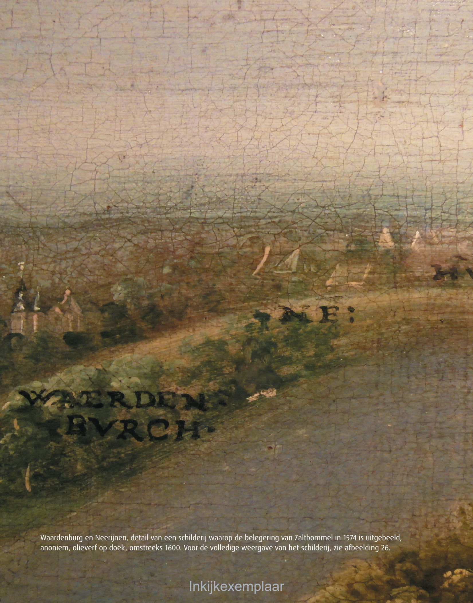
Waardenburg en Neerijnen, detail van een schilderij waarop de belegering van Zaltbommel in 1574 is uitgebeeld, anoniem, olieverf op doek, omstreeks 1600. Voor de volledige weergave van het schilderij, zie afbeelding 26.